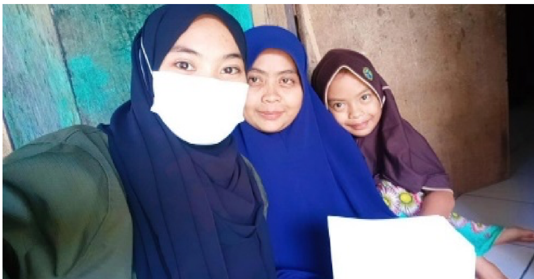
Gambar 2. Penyuluhan kepada Orang Tua dan Anak

Gambar 2 menunjukkan pelaksanaan penyuluhan dilakukan dengan cara mengunjungi rumah ke rumah. Penyuluhan kepada orang tua dilakukan dengan memberikan pemahaman pentingnya peran orang tua dalam mendidik perilaku beribadah anak, pengenalan akidah, akhlak dan fiqih kepada anak sejak dini, mendisiplinkan anak dalam kegiatan beribadah seperti salat dan puasa, merutinkan anak untuk membaca Al-Quran, dan berdoa, serta memerintahkan anak untuk pergi mengaji kepada ustaz. Sedangkan, penyuluhan kepada anak diberikan pemahaman pentingnya disiplin dalam perilaku beribadahnya di kehidupan sehari-hari dan lebih dekat kepada Tuhannya sehingga anak melakukan hal-hal yang bermanfaat.