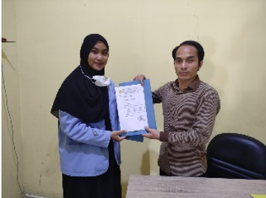
Gambar 1. Observasi dan Wawancara kepada Pihak Desa