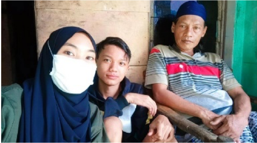
Gambar 3. Evaluasi Perkembangan Anak bersama Ustaz

Gambar 3 menunjukkan evaluasi perkembangan anak bersama ustaz melalui wawancara dan observasi untuk mengetahui hasil dari kegiatan penyuluhan. Hasil evaluasi diketahui bahwa anak-anak menjadi rajin beribadah di masjid, seperti salat dan mengaji. Hal ini disebabkan terdapat beberapa orang tua yang memerintahkan anaknya untuk lebih taat beribadah dengan pergi ke masjid. Sedangkan, orang tua yang acuh terhadap perilaku beribadah anaknya menyebabkan anaknya jarang melakukan ibadah rutin seperti salat, mengaji, dan membaca Al-Quran. Berdasarkan hasil evaluasi kegiatan penyuluhan tersebut dapat disimpulkan bahwa peran orang tua sangat penting dalam perilaku beribadah pada anak.