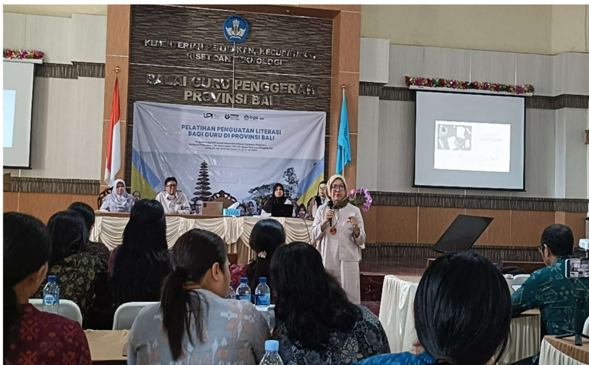
Gambar 2. Kegiatan luring PkM Tim Sastra

Kedua pendapat di atas menyiratkan bahwa menulis kreatif bukan hanya menjadi sarana komunikasi yang efektif, tetapi juga bermanfaat untuk menenangkan pikiran dan menyeimbangkan emosi, khususnya dalam kasus perundungan. Berdasarkan survei, kegiatan kemudian berfokus pada diskusi, setidaknya ada dua hasil diskusi yang patut dicatat. Pertama, sesuai wadah aspirasi mereka, para peserta ini sangat bersemangat dan beberapa memiliki pengalaman menangani perundungan. Dari diskusi tampak bahwa ada upaya meraih peserta didik untuk mencegah korban perundungan. Kedua, pelatihan penulisan kreatif, terutama dengan tujuan mencurahkan emosi, merupakan hal baru bagi peserta mengingat pelatihan sebelumnya lebih tentang pembelajaran bahasa. Peserta tampak tertarik untuk mengikuti pelatihan ini dan berharap dapat mengambil manfaatnya untuk dibagikan kepada peserta didik mereka untuk menangani dan mencegah perundungan di sekolah.