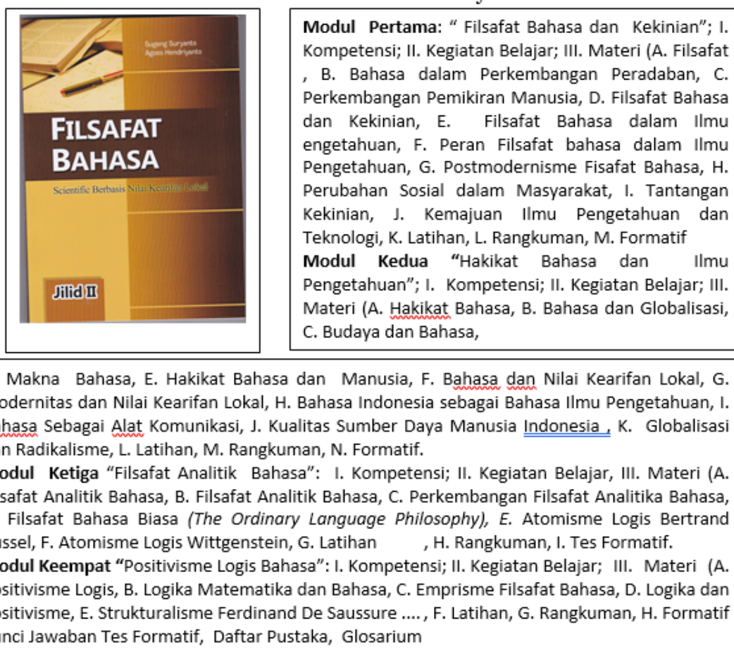
Tabel 4. Filsafat Bahasa Scientific Berbasis Nilai Kearifan Lokal Jilid II