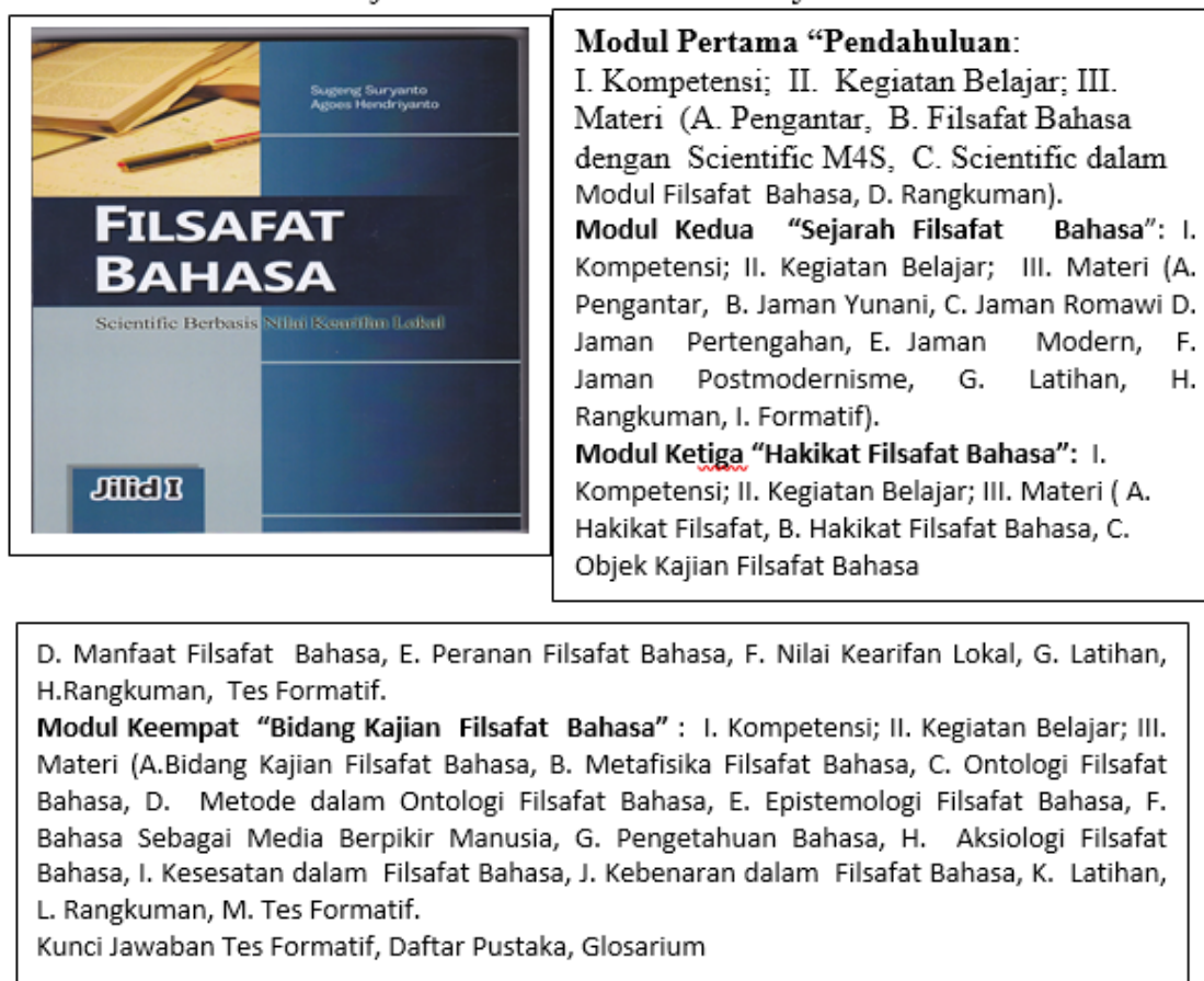
Tabel 3. Filsafat Bahasa Scientific Berbasis Nilai Kearifan Lokal Jilid I

Desain modul filsafat bahasa scientific jilid 1 dan 2 masih memerlukan tahap validasi draf modul “Filsafat Bahasa Scientific Berbasis Nilai Kearifan Lokal” dengan melakukan kegiatan uji dengan angket respon mahasiswa terhadap modul filsafat bahasa scientific . dari hasil angket respon mahasiswa tersebut didapatkan respon mahasiswa 80,2 %. Hasil angket