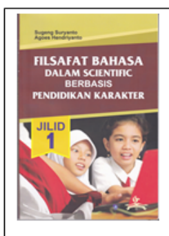
Tabel 2: Desain filsafat bahasa dalam scientific berbasis pendidikan karakter

dasar penalaran dalam logika, sejarah logika, logika sebagai matematika murni, kegunaan logika, macam-macam logika, kesalahan atau kesesatan, simpulan, evaluasi, dan formatif. Modul kelima, tentang “Bahasa dan Filsafat Bahasa” yang terdiri dari beberapa topik seperti: pengertian bahasa, fungsi bahasa, bahasa menurut Ferdinand de Saussure, bahasa menurut Noam Chomsky, serta hubungan antara filsafat dan bahasa, simpulan, evaluasi, dan formatif.