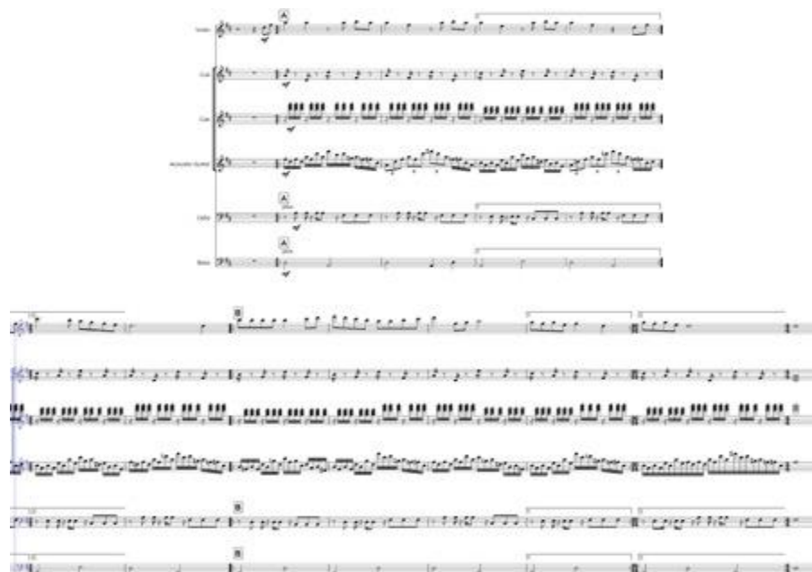
Gambar 3. Transkrip notasi keroncong instrumental

Adegan pada Episode 3 menit 27:15 menampilkan suasana losmen yang tenang dan minim konflik dramatik yang eksplisit. Pergerakan kamera berlangsung perlahan, menyoroti aktivitas keseharian serta ekspresi tokoh secara intim. Dalam konteks visual yang demikian, musik keroncong hadir secara bertahap dan menyatu dengan atmosfer ruang, sehingga keberadaannya tidak terasa sebagai sisipan naratif, melainkan sebagai bagian dari pengalaman sinematik yang sedang berlangsung.