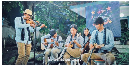
Gambar 2. Momen emosional dari rangkaian keroncong, yang menggambarkan musik sebagai jembatan afektif dan kultural antar tokoh, mewujudkan konsep embodied meaning

Dengan memusatkan perhatian pada satu momen musikal yang jelas, penelitian ini menerapkan pendekatan pembacaan mendalam ( close reading ) terhadap teks audiovisual. Pendekatan ini memungkinkan penguraian yang rinci mengenai keterkaitan antara elemen-elemen musikal seperti ritme, progresi harmonik, instrumen, serta warna bunyi ( timbre ) dengan narasi visual dan konteks dramatik adegan. Dalam kerangka ini, musik tidak diperlakukan sebagai elemen terpisah, melainkan sebagai bagian integral dari konstruksi makna sinematik yang bekerja bersamaan dengan gambar, dialog, dan ritme penceritaan.