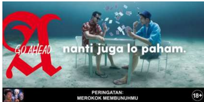
Gambar 1. Billboard Campaign A Mild 'nanti juga lo paham'