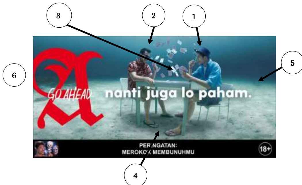
Gambar 2. Elemen pada iklan

Elemen yang membentuk makna iklan ini adalah dua orang pria yang sedang serius memperhatikan isi kartu kemudian salah seorang bertopi biru memandang melihat lawan mainnya, dengan kesan santai menggunakan style orang berlibur di pantai terlihat dari aksesoris yang digunakan kedua orang tersebut, yaitu topi, kaca mata, kemeja tipis, sandal jepit, namun seolah-olah digambarkan sedang bermain di daratan. Elemen lainnya adalah gelembung udara yang dihasilkan oleh kedua orang, kemudian kartu berterbangan, semua objek menapak di dasar lautan, dengan penguat warna biru tua yang menggambarkan berada di dasar laut yang cukup dalam dengan tagline 'nanti juga lo paham.'