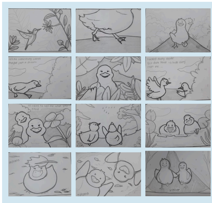
Gambar 2 Story Board.