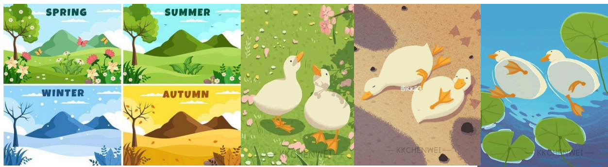
Gambar 1 Mood Board.

Pada tahap ini, penulis melakukan brainstorming untuk mengumpulkan ide-ide terkait visualisasi dari tema lagu " Day by Day ", yang berhubungan dengan perjalanan dua karakter yang diibaratkan sebagai pergantian musim. Kata kunci yang relevan, seperti musim, perubahan, hubungan, dan waktu, menjadi fokus utama dalam pencarian inspirasi visual. Penulis kemudian membuat moodboard , yang berisi referensi visual yang mencakup warna, elemen alam, dan desain karakter yang dapat menggambarkan perjalanan emosional dalam lagu. Papan imajinasi atau istilah moodboard merupakan sebuah papan yang berisi kumpulan ide dalam bentuk potongan gambar, teks atau contoh dari suatu objek. Moodboard digunakan sebagai media yang mempermudah dalam menemukan dan mengembangkan kreativitas sebuah ide (Jannata et al., 2023). Moodboard ini akan menjadi panduan visual untuk seluruh proses pembuatan animasi, membantu penulis untuk tetap terarah dalam menciptakan karya yang konsisten dengan tema lagu.