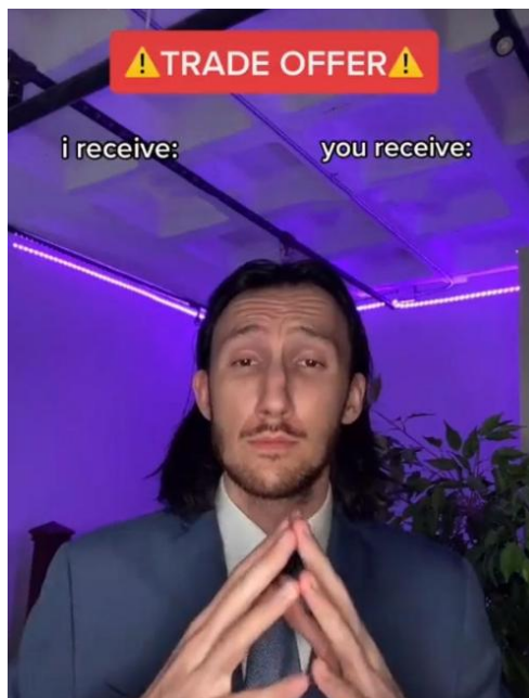
Gambar 1. Template Meme Trade Offer Guy

Sebagai pisau analisis dalam penelitian ini, digunakan teori semiotika Roland Barthes. Barthes menekankan tiga aspek utama dalam pendekatan semiotikanya, yaitu makna denotatif, konotatif, dan mitos. Dalam pandangannya, makna konotatif tidak hanya berfungsi sebagai tambahan makna, tetapi juga mencakup unsur-unsur dari tanda denotatif yang menjadi dasar pembentukannya. yaitu mencakup denotasi, konotasi, dan mitos. Denotasi (makna literal) dan konotasi (makna yang dikaitkan dengan ideologi atau budaya). Barthes juga menekankan pentingnya mitos dalam membentuk pemaknaan yang lebih dalam dari suatu representasi.