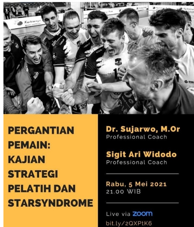
Gambar 1. Flyer/poster Kegiatan Webinar

memiliki kualifikasi FIVB Level II Internasional sehingga dari teori maupun praktek memiliki kompetensi dalam menyampaikan materi tentang bola voli.