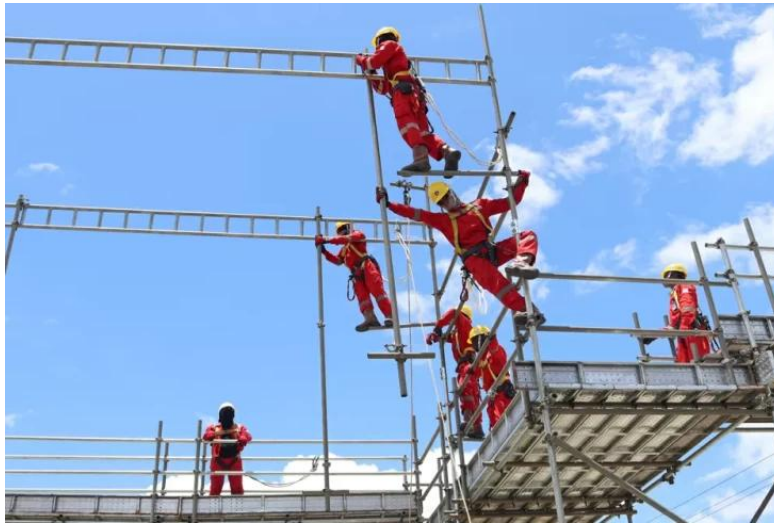
Gambar 3. Masyarakat Teluk Bintuni, Papua Barat mengikuti pelatihan vokasi Scaffolding yang diselenggarakan Pusat Pelatihan Teknik Industri dan Migas (P2TIM).

kota/kabupaten lainnya di seluruh wilayah Papua. Pemerintah dapat bekerja sama dengan industri ataupun entitas lainnya dalam melaksanakan pelatihan-pelatihan vokasi pada seluruh wilayah di Papua.