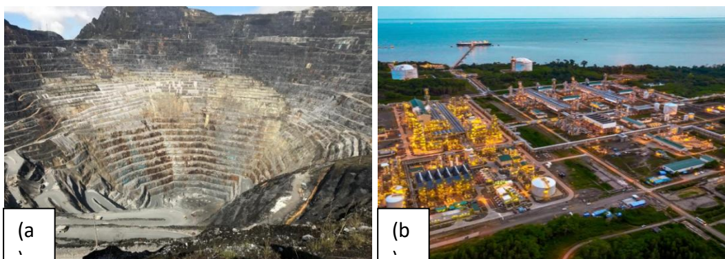
Gambar 2. Pertambangan emas terbesar di dunia pada site Grasberg, Papua Tengah (a), dan Proyek Liquefied Natural Gas di Teluk Bintuni, Papua Barat (b).

Potensi sumber daya alam yang dimiliki Papua sangat besar, khususnya yang berasal dari sektor pertambangan. Diantaranya adalah pertambangan tembaga, emas serta nikel. Papua memiliki potensi 2,5 miliar ton batuan bijih emas dan tembaga, sebagian besar terdapat pada wilayah konsesi PT Freeport Indonesia. Disamping itu masih terdapat beberapa potensi tambang lain seperti batu bara yang memiliki cadangan sekitar 6,3 juta ton, pasir kuarsa dengan potensi cadangan sebesar 21,5 juta ton, lempung sebesar 1,2 juta ton, marmer sebesar 350 juta ton, granit sebesar 125 juta ton dan hasil tambang lainnya. Selain itu juga terdapat potensi pada sektor minyak dan gas bumi yang terdapat di Teluk Bintuni provinsi Papua Barat yang dikelola perusahaan multinasional British Petroleum (BP), juga terdapat potensi minyak dan gas bumi di kabupaten Merauke yang menyimpan sekitar 14,4 kubik feet yang mana memberikan kontribusi lebih dari 50% terhadap perekonomian di Papua.