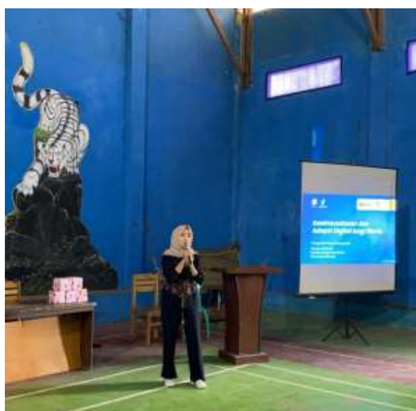
Gambar 2. Pemberian Materi Oleh Narasumber

Sebagai langkah awal pelaksanaan kegiatan pengabdian kepada masyarakat dalam Program Pengembangan Ekonomi dan Kewirausahaan (PbM-PPEK), tim pelaksana melaksanakan survei intensif dan sistematis di Desa Pusparahayu, Kecamatan Puspahiang, Kabupaten Tasikmalaya. Survei ini menjadi fondasi utama dalam merancang intervensi program secara kontekstual, relevan, dan berbasis kebutuhan nyata masyarakat. Teknik pengumpulan data yang digunakan meliputi wawancara mendalam ( in-depth interview ), penyebaran kuesioner semi-terstruktur, serta diskusi kelompok terfokus atau Focus Group Discussion (FGD). Pelibatan berbagai elemen masyarakat sangat diutamakan, termasuk tokoh masyarakat, petani manggis lokal, pelaku usaha mikro, serta perwakilan pemuda dan perempuan yang menjadi bagian penting dalam pembangunan ekonomi desa.