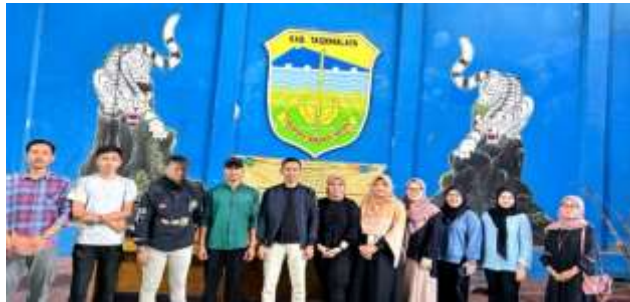
Gambar 4. Tim PPM dan Perwakilan Peserta

Dengan didampingi oleh tim fasilitator, peserta diajak membuat akun di platform marketplace seperti Shopee dan Tokopedia. Langkah demi langkah dilakukan secara bergiliran, mulai dari pendaftaran, pengisian profil toko, hingga pengunggahan produk asli milik peserta, seperti manggis segar, keripik pisang, atau kerajinan tangan dari bambu. Peserta juga diajarkan cara menulis deskripsi produk yang informatif, menentukan harga kompetitif, dan menghitung ongkos kirim secara otomatis melalui fitur aplikasi.