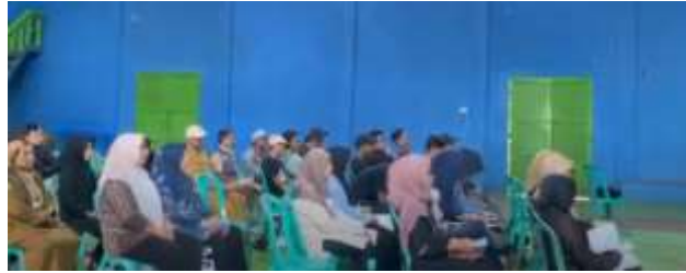
Gambar 3. Peserta Seminar

Survei ini mengadopsi pendekatan partisipatif yang terinspirasi dari pedoman praktik terbaik pemberdayaan desa, seperti yang dikemukakan dalam Rural Youth Best Practices Guidebook (ruralityouth.ogu.edu.tr) , yang menekankan pentingnya pemetaan kebutuhan secara inklusif dan keterlibatan aktif komunitas lokal dalam setiap tahapan program. Melalui pendekatan tersebut, tim berhasil membangun komunikasi yang baik dengan masyarakat, menciptakan suasana saling percaya, serta menggali informasi yang akurat dan komprehensif tentang kondisi sosial ekonomi desa.