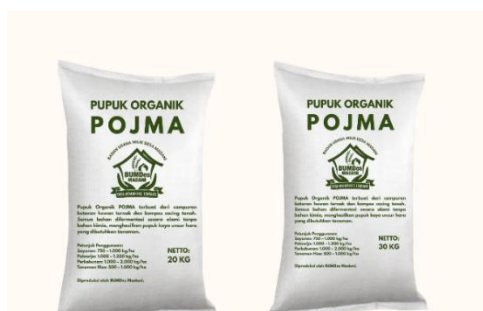
Gambar 8. Tampilan Label Kemasan Pupuk.