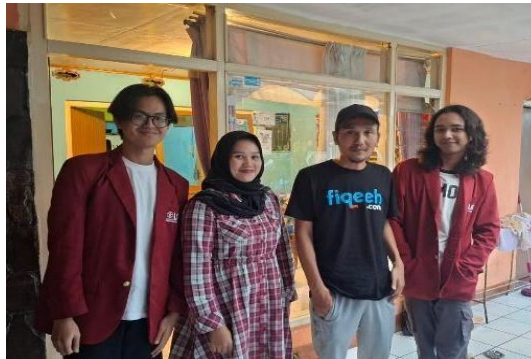
Gambar 3. Perencanaan Program Pendampingan

laporan keuangan kepada jajaran pengurus BUMDes, terutama kepada Sekretaris dan Bendahara, agar mampu memahami serta melaksanakan proses tersebut secara mandiri di kemudian hari. Pendekatan ini penting guna mendorong akuntabilitas dan transparansi dalam pengelolaan keuangan desa (Sari et al., 2024; Arista et al., 2021).