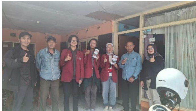
Gambar 5. Memberikan Hasil Output Pendampingan

Solusi yang ditawarkan dalam kegiatan pendampingan ini berfokus pada peningkatan kualitas sumber daya manusia (SDM), khususnya dalam aspek pengembangan inovasi kelembagaan dan manajerial BUMDes. Upaya ini dilakukan melalui pendekatan pendampingan kolaboratif yang bersifat partisipatif dan berkelanjutan. Pendampingan ini mencakup fasilitasi langsung dalam penyusunan laporan keuangan yang tidak hanya bertujuan untuk mencatat transaksi semata, tetapi juga diarahkan agar proses pelaporan dapat dilakukan secara sistematis, transparan, dan dapat dipertanggungjawabkan sesuai dengan struktur organisasi kepengurusan BUMDes.