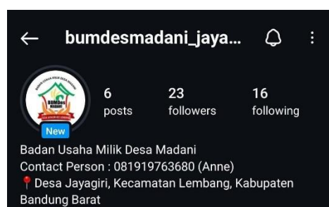
Gambar 9. Pembuatan Akun Instagram