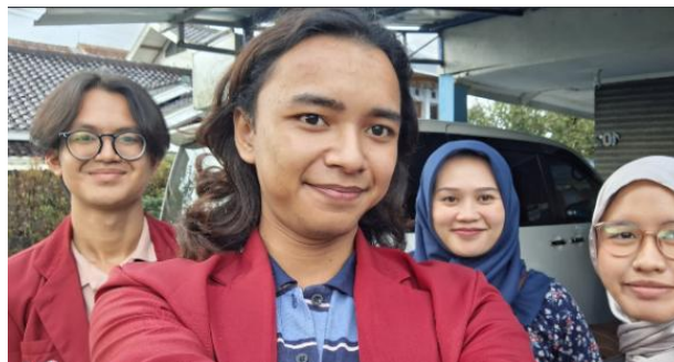
Gambar 4. Penyusunan Laporan Keuangan

Pertemuan ketiga dilaksanakan pada Selasa, 6 Mei 2025. Tujuan dari pertemuan ketiga adalah memulai pendampingan dalam penyusunan laporan keuangan. Dari pihak BUMDes telah menyusun laporan keuangan menggunakan template excel yang diberikan oleh Kementerian Desa (Kemendes). Pendamping mulai menyusun laporan keuangan dari mengumpulkan bukti transaksi hingga laporan pertanggung jawaban keuangan. Setelah itu, hasil laporan keuangan yang telah disusun oleh pendamping disandingkan dengan laporan keuangan pihak BUMDes dan melakukan Cross Check guna menghindari salah saji.