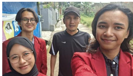
Gambar 2. Penggalan informasi terkait BUMDes Madani