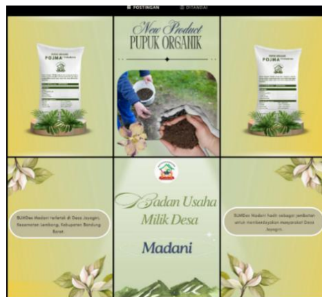
Gambar 11. Tampilan Feeds Instagram BUMDes Madani