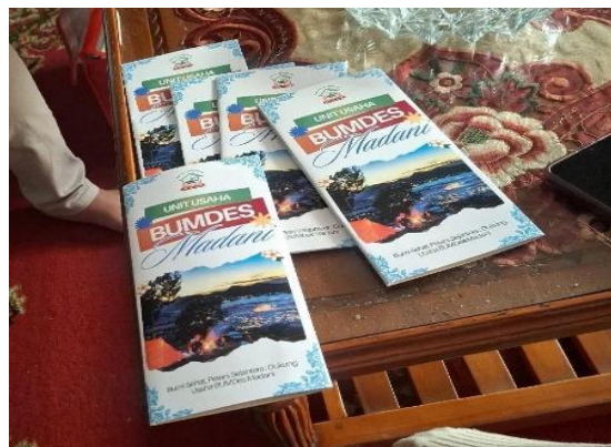
Gambar 7. Tampilan Brosur yang sudah jadi