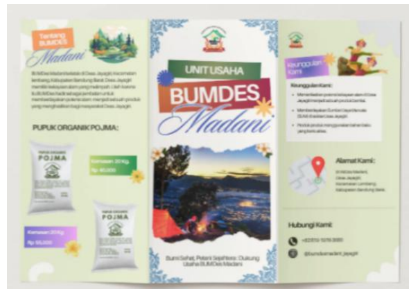
Gambar 6. Tampilan Halaman Depan Brosur