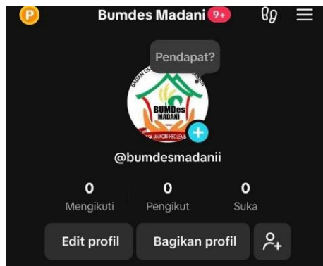
Gambar 10. Pembuatan Akun Tiktok