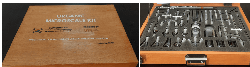
Gambar 2. Organic microscale kit .

Pada tahap perencanaan, dilakukan penentuan judul praktikum skala mikro yaitu titrasi asam-basa. Pemilihan topik titrasi asam-basa karena praktikum ini sering dilaksanakan di sekolah dan menggunakan bahan yang mudah diperoleh dalam kehidupan sehari-hari. Alat yang digunakan dalam praktikum skala mikro adalah Organic Microscale Kit yang dikembangkan oleh UPI dan disponsori oleh LUPIC ( Leading University Project for International Cooperation ) yang bekerjasama dengan Sogang University, UNNES, dan UNDIKSHA. Organic Microscale Kit dapat dilihat pada Gambar 2. Untuk praktikum titrasi alat yang digunakan adalah buret, Erlenmeyer, gelas kimia, dan statif. Bahan yang digunakan dalam titrasi adalah NaOH, asam asetat, dan indikator fenolftalein (pp).