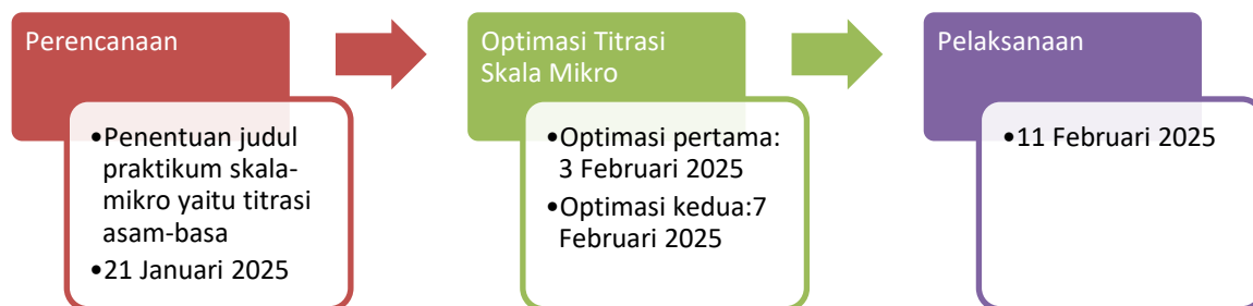
Gambar 1. Alur kegiatan pelatihan praktikum titrasi skala mikro.

Sebelum dilaksanakan pengabdian ke sekolah, terlebih dulu disiapkan hal-hal yang diperlukan dalam pelatihan praktikum titrasi skala mikro. Secara lebih detail, alur kegiatan Pelatihan Praktikum Titrasi Skala Mikro ditunjukkan pada Gambar 1.