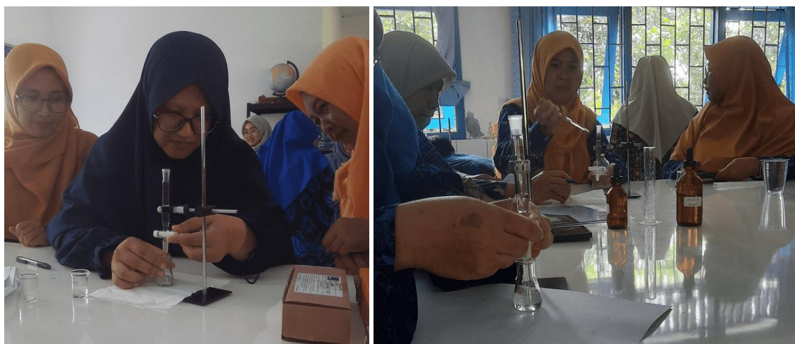
Gambar 3. Kegiatan Praktikum Titrasi Skala Mikro

Dari Gambar 3 dapat dilihat bahwa guru sudah memiliki keterampilan praktikum titrasi skala mikro. Hal ini juga terlihat dari kuesioner yang menyatakan bahwa semua guru (100%) pernah melakukan praktikum titrasi di sekolah, sehingga guru dapat memasang dan menggunakan alat dengan benar. Guru juga dapat melakukan praktikum dengan baik. Titrasi dilakukan sebanyak dua kali pengulangan (duplo), sehingga guru dapat bergantian dengan anggota kelompoknya untuk melakukan titrasi secara langsung. Setelah titrasi, masing-masing kelompok mengisi LKPD yang disediakan. Jawaban guru diberikan pada Tabel 1.