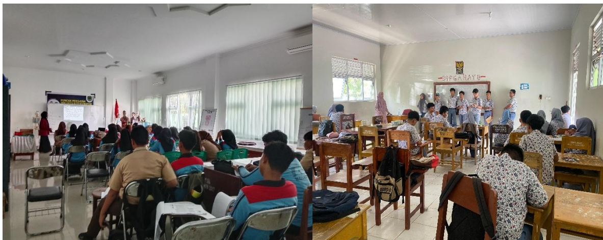
Gambar 2. Dokumentasi proses kegiatan belajar mengajar yang dilakukan oleh mahasiswa PLP.

Guru pamong memberikan keleluasaan kepada mahasiswa untuk mengembangkan kegiatan belajar mengajar, termasuk dalam hal evaluasi, pembuatan video pembelajaran, dan Lembar Kerja Peserta Didik (LKPD), dengan syarat tetap mengikuti struktur yang tercantum dalam modul ajar. Gambar 2 menunjukkan suasana proses pembelajaran yang berlangsung selama periode tersebut.