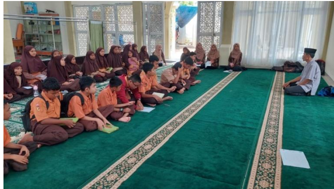
Gambar 5. Preparasi sebelum memilih hafalan.

Tahap ketiga yaitu evaluasi, di SMP Negeri 5 Bukittinggi, evaluasi keseluruhan pendampingan ekstrakurikuler tahfiz dengan metode Tasmî' dilakukan dengan meminta peserta didik menghafal ayat di depan guru pendamping. Hal ini dilakukan untuk memberikan guru kesempatan untuk menilai tingkat hafalan dan bacaan semua peserta didik (Gambar 5).