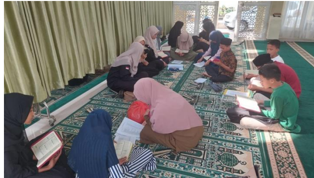
Gambar 3. Pelaksanaan pendampingan ekstrakurikuler tahfiz.

Pada tahap ketiga, peserta didik diminta untuk mengingat ayat tersebut (Gambar 3). Guru pendamping selalu bersama peserta didik dan memastikan bahwa mereka tetap fokus menghafal dan tidak mengganggu teman yang lain. Jika peserta didik menghafal ayat berikutnya dengan lancar dan benar, mereka dapat melanjutkan. Jika peserta didik sudah hafal, mereka diminta untuk membacakan hafalan tersebut kepada guru pendamping mereka. Guru pendamping harus memperbaiki pengucapan apabila ada kesalahan dan memberikan contoh yang benar. Setelah itu, peserta didik diminta untuk memperbaiki teks dan menyerahkan kembali hafalan mereka jika sudah menghafal dengan benar dan baik.