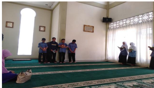
Gambar 4. Kompetisi tahfiz di luar kelas.

Tujuan atau target hafalan tidak tercapai atau pelaksanaan kegiatan terhambat jika guru pendamping tidak kreatif dalam melakukan kegiatan ini. Peserta didik diminta untuk membacakan atau mentasmi hafalan yang telah mereka hafalkan kepada guru pendamping mereka setiap minggu. Untuk meningkatkan ingatan peserta didik, guru dapat meninjau hafalan tersebut. Setiap dua bulan, guru pendamping mengadakan kompetisi: menyambung ayat, memberikan penjelasan tentang isi suatu surah, menebak jumlah ayat, dan membaca ayat tanpa melihat Al-Quran sesuai dengan nama surah (Gambar 4). Ini dilakukan untuk menerapkan sistem hadiah dan hukuman kepada peserta didik dengan memberikan hadiah seperti Al-Quran, buku, pena, coklat, dan permen, secara langsung di depan kepala sekolah, guru, dan peserta didik lainnya. Jika peserta didik tidak memenuhi target hafalan, mereka akan dihukum dengan membaca surah yang belum dihafal sepuluh kali di depan guru mereka. Mereka juga akan dimotivasi dan didorong untuk lebih sering menghafal surah. Hal ini bertujuan untuk mengetahui sejauh mana kemampuan peserta didik untuk mempertahankan hafalan mereka. Setelah melihat teman-temannya mencapai target hafalan dan mendapatkan reward dari guru mereka, peserta didik yang awalnya tidak termotivasi untuk menghafal karena belum mahir membaca Al-Quran menjadi lebih termotivasi.