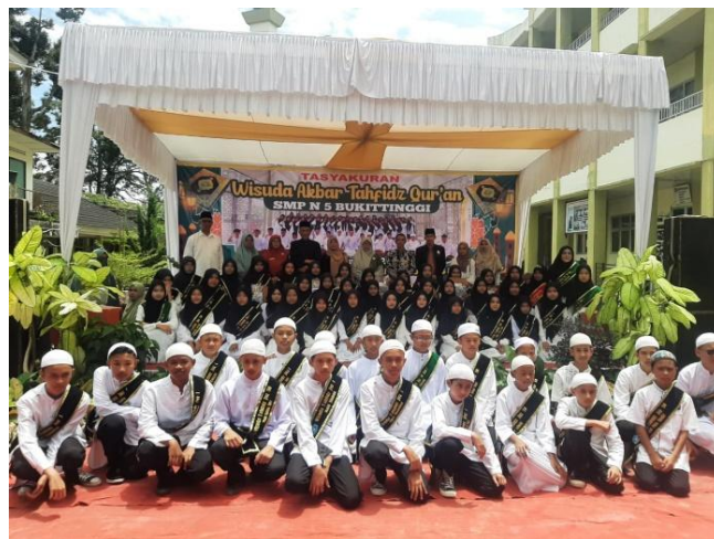
Gambar 6. Acara wisuda tahfiz di luar kelas.

Pada tahap evaluasi ini, siswa diminta untuk menghafal ayat dari Juz 30 secara bergiliran di hadapan guru pendamping. Guru pendamping dapat menilai kualitas hafalan peserta didik dengan menyeter hafalan ayat tersebut. Setelah menyerahkan hafalan mereka kepada guru pendamping, siswa kemudian menyerahkan hafalan mereka kepada pembina ekstrakurikuler tahfiz untuk mengevaluasi kemampuan bacaan dan hafalan siswa. Setelah peserta didik menghafal Juz ke-30, mereka berhak mengikuti wisuda tahfiz periode kedua pada bulan Desember 2023 (Gambar 6).