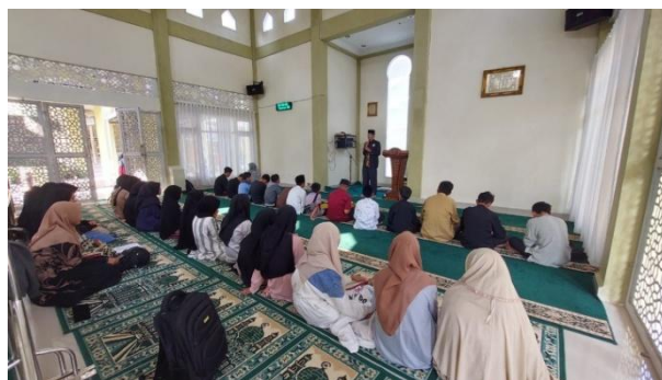
Gambar 2. Proses pemberian motivasi kepada peserta tahfiz.

Sebelum pendampingan dimulai, guru pendamping harus memberikan motivasi yang berkaitan dengan Al-Quran dan tahfiz serta menjelaskan manfaat menghafal Al-Quran agar peserta didik tertarik dan termotivasi untuk melakukannya (Gambar 2). Motivasi untuk menghafal Al-Quran bisa datang dari dukungan guru tahfiz, untuk itu penting sekali bagi guru tahfiz untuk memberikan dukungan dan perhatian kepada peserta didik yang mengikuti tahfiz agar mereka semangat dalam menghafalkan ayat-ayat Al-Quran (Zaini, 2020).