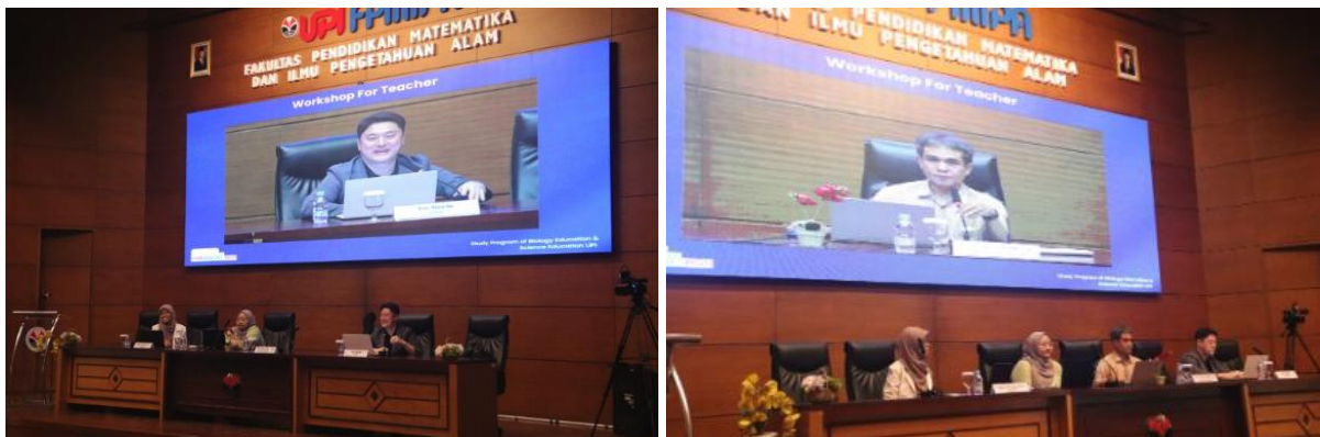
Gambar 1. Sesi pematerian oleh narasumber tentang asesmen pembelajaran berbasis AI.

Sebagaimana ditunjukkan pada Gambar 1, sesi ini menampilkan pemaparan materi oleh Prof. Minsu Ha mengenai konsep dan peluang penggunaan kecerdasan buatan dalam asesmen pembelajaran kepada para peserta workshop . Diskusi tersebut semakin diperkaya dengan pemaparan dari Prof. Ari Widodo, guru besar Pendidikan IPA, Universitas Pendidikan Indonesia, yang menjelaskan bagaimana asesmen berbasis AI dapat dikontekstualisasikan dalam pembelajaran IPA di Indonesia. Kolaborasi dan dialog antara kedua narasumber ini membantu peserta memahami tren global sekaligus relevansi lokal dari penerapan AI dalam praktik asesmen di kelas.