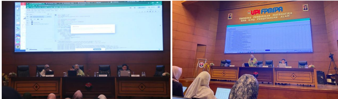
Gambar 3. Sesi praktik para guru untuk melakukan penilaian jawaban uraian otomatis berbantuan AI.

Dalam sesi praktik (Gambar 3), peserta workshop berkesempatan mengunggah contoh data jawaban siswa dan mengamati bagaimana sistem melakukan penilaian otomatis. Melalui kegiatan ini, para guru mendapatkan pengalaman langsung mengenai potensi pemanfaatan AI dalam membantu proses evaluasi pembelajaran. Workshop ditutup dengan sesi diskusi interaktif yang hangat, di mana peserta mengajukan berbagai pertanyaan terkait penerapan AI di kelas, tantangan teknis, serta pertimbangan etis dalam penggunaannya. Prof. Ha menekankan pentingnya sikap terbuka terhadap teknologi dan mengajak para guru untuk melihat AI sebagai mitra dalam meningkatkan kualitas pembelajaran dan asesmen di era digital. Kegiatan ini diharapkan dapat membantu guru memanfaatkan teknologi AI untuk meningkatkan efisiensi dan akurasi penilaian tanpa mengabaikan peran reflektif guru sebagai pengambil keputusan akhir.