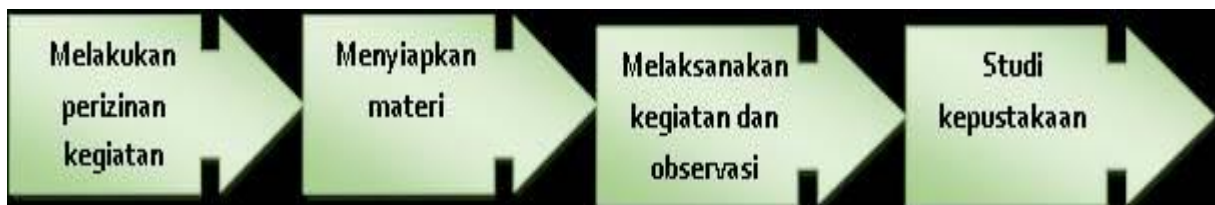
Gambar 1 Diagram Metode Penelitian

Penelitian ini merupakan penelitian kualitatif. Lokasi penelitian berada di Desa Cintaraja, Kecamatan Singaparna, Kabupaten Tasikmalaya pada Agustus 2023. "Omat ti SiPenting" merupakan kegiatan sosialisasi olah makanan sehat dari mahasiswa peduli stunting, disampaikan kepada orang tua yang memiliki anak balita melalui media presentasi dan brosur. Brosur yang diberikan berisi tentang pengenalan stunting dan berbagai jenis teknik mengolah makanan sehat. Pengumpulan data pada penelitian ini dilakukan dengan cara mengobservasi kegiatan di beberapa Posyandu di Desa Cintaraja dan melakukan studi kepustakaan.