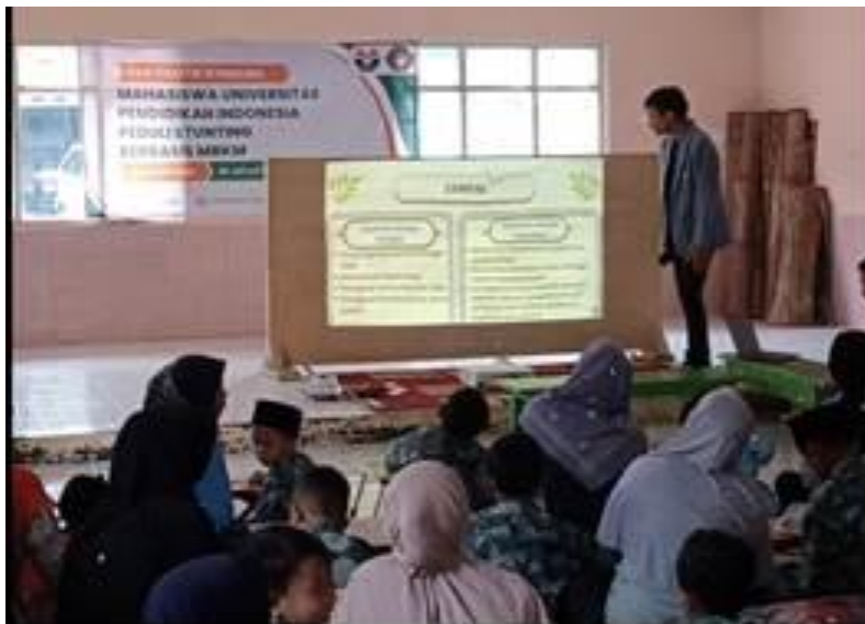
Gambar 3 Kegiatan Omat ti SiPenting

terhadap pertumbuhan dan perkembangan berat badan pada anak balita (Nurhayati et al., 2020).