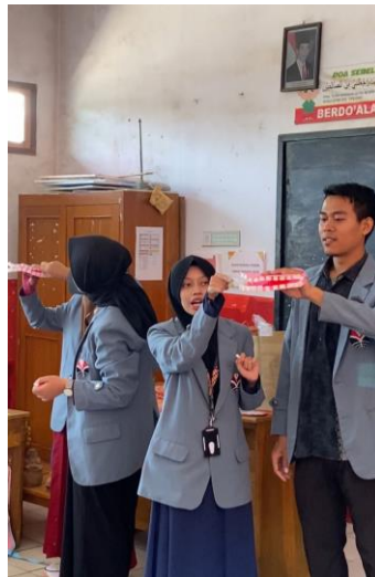
Gambar 1. Penyampaian Materi Penyuluhan Sikat Gigi melalui Alat Peraga

Program Kuliah Kerja Nyata mengenai "Penyuluhan Sikat Gigi Yang Baik Dan Benar SDN 1 Sirnajaya" sudah dilaksanakan pada hari Selasa tanggal 09 Agustus 2023 di SDN 1 Sirnajaya. Sasaran dari program pelaksanaan Penyuluhan Sikat Gigi ini yaitu siswa-siswi kelas 2 SDN 1 Sirnajaya. Siswa-siswi yang hadir dalam pelaksanaan kegiatan Penyuluhan Sikat Gigi yang Baik dan Benar berjumlah 44 orang. Kegiatan ini dimulai pada pukul 08.00 – 10.00 WIB. Persiapan kegiatan disiapkan oleh mahasiswa pada pukul 07.30 – 08.00 WIB. Kemudian penyampaian materi dan pelaksanaan kegiatan dimulai pada pukul 08.00 – 10.00 WIB.