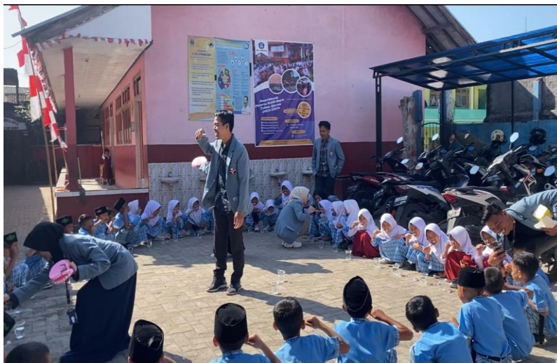
Gambar 2. Praktik Sikat Gigi yang Baik dan Benar

Cara menyikat gigi dilakukan secara bertahap untuk setiap sisi permukaan gigi. Anak-anak diminta langsung untuk mengikuti setiap tahap yang dicontohkan. Dalam melakukan sikat gigi, setiap gerakan yang dilakukan harus mampu membersihkan sisa makanan serta plak yang melekat pada permukaan gigi. Gerakan sikat gigi yang dilakukan tidak boleh terlalu keras karena dapat menimbulkan trauma (Baruah, dkk., 2017).