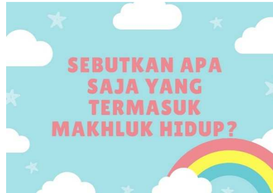
Gambar 3. Isi Materi