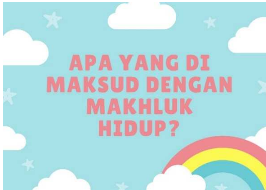
Gambar 2. isi Materi

Perancangan media pembelajaran yang dikembangkan berupa kartu bergambar berupa mahluk hidup. Tujuan ini agar siswa dapat lebih mudah untuk memahami materi dengan menggunakan kartu bergambar pada pelajaran IPA untuk mengidentifikasi makhluk hidup.