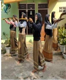
Gambar 4. Gerak Ogan