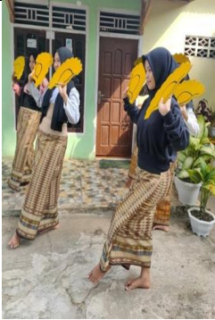
Gambar 6. Gerak Semende