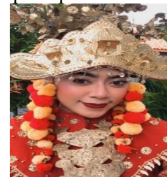
Gambar 9. Rias tari

Tata rias dan busana harus membantu menyatu dan menyangga kekuatan maupun wujud garapan gerak dengan berbagai komponen dan unsurnya sehingga merupakan kesatuan yang utuh (Tasman, 1987:3). Rias yang digunakan dalam tari ini adalah rias korektif (rias cantik) dan dalam penataan rias tidak mengandung makna secara khusus. Rias digunakan untuk mempercantik para penari.