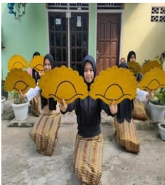
Gambar 7. Gerak Ranau