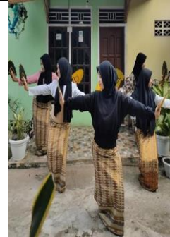
Gambar 8. Gerak Daye