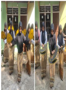
Gambar 3. Gerak Silang