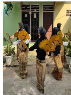
Gambar 5. Gerak Komering