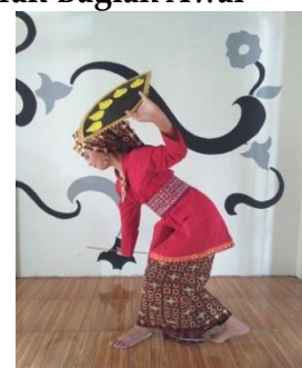
Gambar 1 Gerak Lapah Batin/Tabik