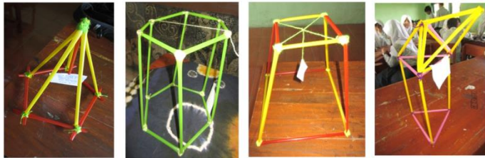
Gambar 1 Kerangka Bangun Ruang Hasil Kreativitas Siswa

Pembelajaran PM-APOS menekankan pada hands on activity dengan harapan dapat mengoptimalkan pemahaman siswa mengenai suatu materi, sebagaimana yang dijelaskan oleh Bruner yakni belajar yang baik dengan cara memanipulasi benda-peraga dari kehidupan sekitar, dengan cara ini pemaknaan terhadap materi bahan ajar menjadi kuat tertanam dalam kognitif siswa (Suherman, 2008). Pemanipulasian benda konkret tersebut dilakukan secara bertahap, yaitu enactive dengan cara memanipulasi benda konkret secara nyata, misalkan menggunakan bangun ruang yang dibuat oleh siswa dalam memahami konsep titik, garis, dan bidang. Selanjutnya yaitu iconic bangun ruang yang telah dibuat, digambarkan dalam bentuk sketsa. Tahap terakhir yakni symbolic , memanipulasi simbol abstrak. Simbol yang terbentuk pada tahap inilah yang selanjutnya digunakan dalam memaknai konsep titik, garis, dan bidang.