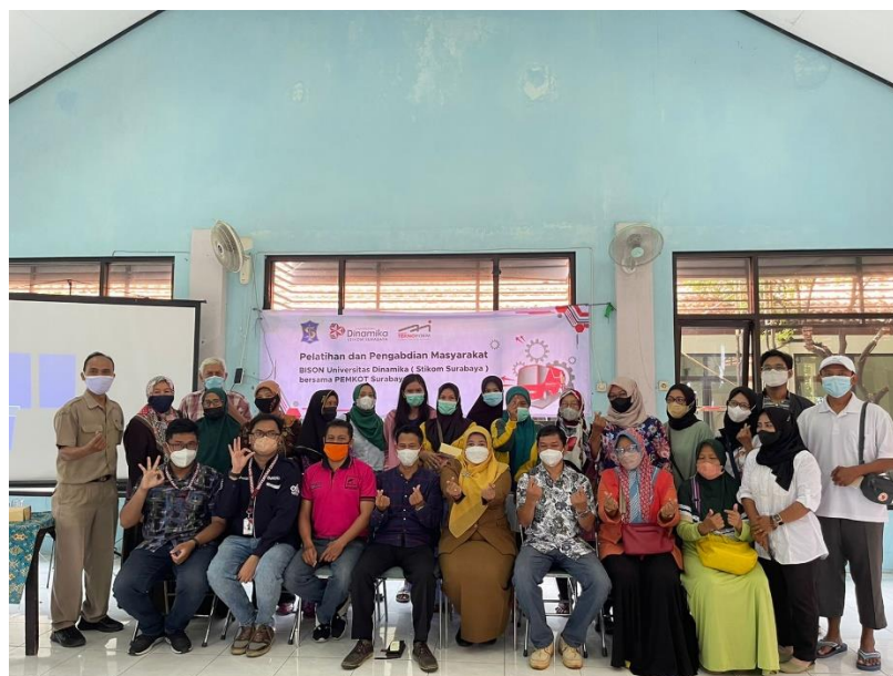
Gambar 5. Foto bersama dari Pemateri dan Peserta Pelatihan