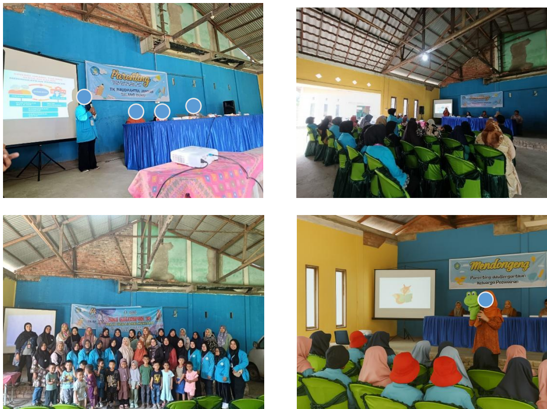
Gambar 1. Dokumentasi Kegiatan Mendongeng dan Parenting

Masih pada hari yang sama, kegiatan dilanjutkan dengan sesi konseling individual dan kelompok bagi orang tua, terutama bagi mereka yang membutuhkan pendampingan lebih lanjut. Dalam sesi ini, fasilitator menyediakan waktu untuk berdiskusi secara lebih mendalam dan personal mengenai isu-isu pengasuhan yang sensitif atau kompleks. Konseling dilakukan secara tertutup dan diarahkan untuk membangun solusi yang realistis dan kontekstual sesuai dengan kondisi keluarga masing-masing.