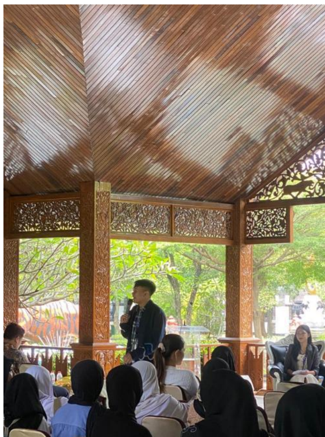
Gambar 1. Sosialisasi Model PKn Berbasis Community Civic dalam Memperkuat Civic Competence Mahasiswa dan Memberdayakan Masyarakat

Pertama , finalisasi kajian akademik, berfokus pada landasan teoretis, tujuan ilmiah serta rasionalisasi merealisasikan pembelajaran PKn di masyarakat yang berbasiskan community civic . Mengingat setiap aktivitas begitu identik prinsip-prinsip ilmiah, maka praksis PKn berbasis community civic tidak sebatas aksi subjektif, tetapi memuat nilai, prinsip dan basis ilmiah, agar objektif, berkelanjutan, inklusif dan berdampak nyata dalam memberdayakan masyarakat dan memperkuat mutu civic competence mahasiswa. PKn menjadi wahana peningkatan civic engagement berbasis wawasan dan awareness warga negara dalam bidang sosial dan politik, tetapi fakta PKn yang lebih dominan teoretis menjadi kritik ilmiah, mengingat menghambat kampanye PKn sebagai wahana civic engagement yang inklusif, utuh dan transformatif (Eidhof & Ruyter, 2022). Finalisasi kajian akademik adalah bukti nyata lahirnya persamaan persepsi, visi dan spirit moral dalam praksis PKn berbasis community civic yang memperkuat kapasitas civic competence mahasiswa, menyelesaikan problematik sosial juga memberdayakan masyarakat secara berkelanjutan.