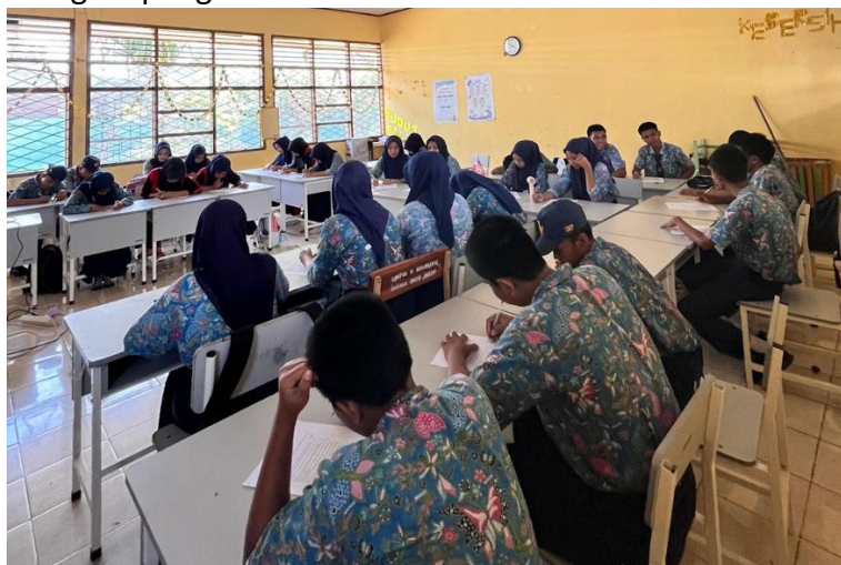
Gambar 2. Pelaksanaan pretest pada siswa

Capaian hasil pretest yang dilaksanakan pada tahap awal kegiatan edukasi interaktif. Pretest dilakukan dengan langkah-langkah sistematis, yaitu: Instruksi Awal - Siswa diberikan penjelasan singkat mengenai tujuan pretest serta tata cara pengisian kuesioner. Pengisian Kuesioner – Setiap siswa mengerjakan instrumen berisi soal pilihan ganda yang disusun untuk mengukur tiga aspek utama: literasi seksual, kekerasan seksual, serta relasi dan komunikasi sehat. Waktu Pelaksanaan – Pretest dikerjakan secara individu dalam waktu \pm 15 menit, tanpa bantuan guru atau teman sebaya, sehingga jawaban merefleksikan pemahaman asli siswa. Pengumpulan Data – Kuesioner dikumpulkan untuk diolah dan dianalisis oleh tim pelaksana sebagai gambaran tingkat pengetahuan awal siswa.