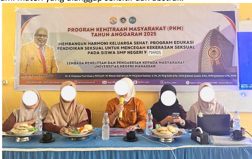
Gambar 3. Proses Sosialisasi Literasi Seksual

audio visual berupa slide, video edukatif, dan ilustrasi kontekstual sehingga memudahkan siswa memahami materi yang dianggap sensitif dan abstrak.