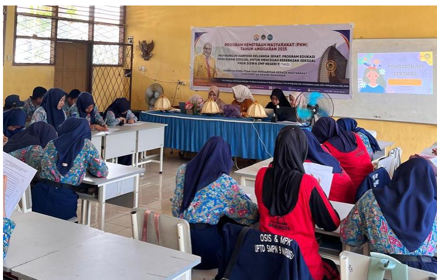
Gambar 4. Pelaksanaan Posttest Terkait dengan Literasi Seksual

Pada gambar 4 menunjukkan proses pelaksanaan post-test yang dilakukan setelah seluruh rangkaian sosialisasi dan kuis interaktif selesai. Tahapannya meliputi pemberian instruksi, pengisian kuesioner secara individu selama \pm 15 menit, hingga pengumpulan hasil untuk dianalisis.