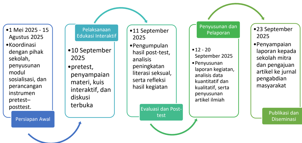
Gambar 1. Lini Masa Pengabdian Kemitraan Masyarakat (PKM) Tahun Anggaran 2025

sekolah. Metode yang digunakan dalam kegiatan ini adalah metode pelaksanaan berbasis edukasi interaktif, dengan evaluasi menggunakan pendekatan kuantitatif deskriptif melalui analisis pretest–post-test , serta diperkuat oleh data kualitatif dari keterlibatan siswa dalam kuis interaktif dan diskusi terbuka. Metodologi kegiatan dirancang dalam empat tahapan utama: persiapan awal, pelaksanaan, evaluasi, dan pelaporan. Pendekatan dipilih untuk memastikan bahwa kegiatan berlangsung secara sistematis, dapat diukur keberhasilannya, serta menghasilkan luaran yang dapat didiseminasikan secara akademik maupun praktis.