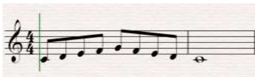
Gamba. Contoh partitur pemanasan humming (Dokumentasi: Nisyar Fauzi, 2019)

Sedangkan teknik lips trill dilakukan dengan cara menggetarkan bibir atas dan bawah sampai menghasilkan nada dengan konsonan “brrr..”. Apabila dirasa sulit, dapat menggunakan bantuan dengan menekankan ibu jari dan telunjuk jari di kedua ujung bibir, apabila masih tidak bisa pelatih