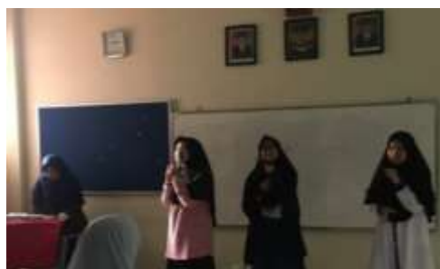
Penampilan siswa membawakan lagu Muhasabah Cinta (Dokumentasi: Nisyar Fauzi, 23 Juli 2019)

Bersama Pesantren Daarut Tauhiid, mencoba mengembangkan Nasyid sebagai sebuah ritual keagamaan, untuk mengingat Rasul dan sebagai usaha mendekatkan diri kepada Allah. Dalam penelitian ini, penulis memilih nasyid. Selain sudah dikenal oleh peserta didik, nasyid juga sesuai dengan lingkungan sekolah yang berbasis keagamaan. Salah satu kelebihan ekstrakurikuler pembelajaran Nasyid disekolah tersebut yaitu dapat membantu dan menambah nilai religi serta nilai pendidikan agar siswa memiliki perilaku yang islami. Dari pengamatan sementara pelatihan SMP Daarut Tauhiid Bording School Putri banyak menghasilkan siswa-siswa yang berprestasi dalam bidang lagu islami diantaranya sering menjadi juara kompetisi. Nasyid Melalui pemaparan tersebut, penulis termotivasi untuk melakukan penelitian lebih dalam, dengan fokus kajian diarahkan pada Pelatihan nasyid di SMP Daarut Tauhiid Bording School, dimana temuan hasil penelitiannya diharapkan dapat berkontribusi bagi referensi khasana pendidikan seni di Indonesia.