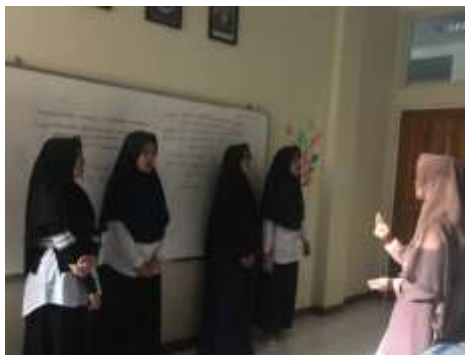
Siswa Berlatih Pernafasan (Dokumentasi: Nisyar Fauzi, 23 Juli 2019)

benar, dapat mengembangkan lagu nasyid yang lain tanpa arahan pelatih, Dapat melantunkan lagu Muhasabah Cinta dengan berusaha menerapkan hasil teknik vokal yang diajarkan.