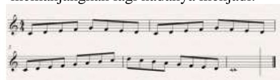
Gambar. Melodi Pemanasan Artikulasi

Setelah siswa dapat membunyikan melodi tersebut dengan teknik artikulasi, pelatih memanjangkan lagi nadanya menjadi: