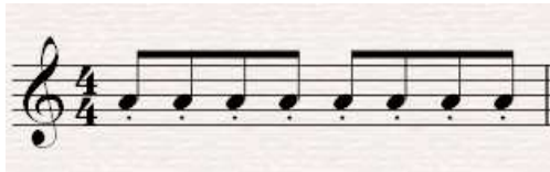
Gambar. Conoh patitur teknik staccato (transkripsi: Nisyar Fauzi, 2019)

dilakukan. Pada saat membuang nafas, selain dihembuskan secara perlahan, juga dicontohkan pelatih dengan cara desis (mengucapkan “tsss) dengan tujuan melatih stabilitas nafas. Ketika hembusan nafas dibunyikan dengan desis, maka setiap siswa bisa diketahui stabilitas hembusan nafasnya. Selain itu juga dikombinasikan dengan teknik staccato , dengan terputus-putus.