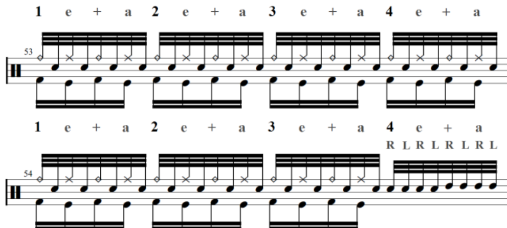
Gambar 8. Bar 53-54, Blastbeat