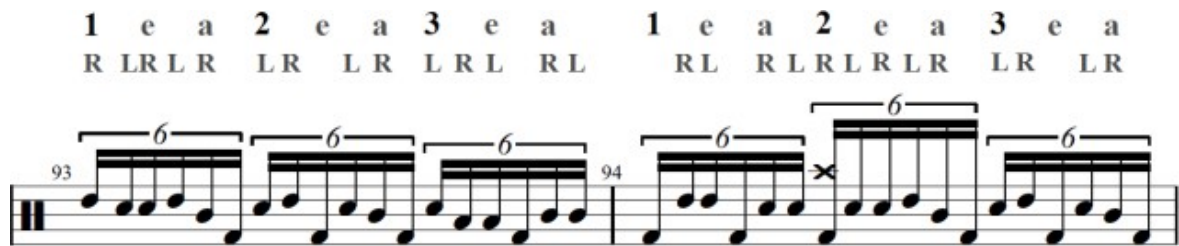
Gambar 7. Bar 93-94, Improvisation Tom/Chop

Improvisation tom atau improvisasi tom merupakan sebuah permainan drum dimana drummer melakukan beberapa pukulan secara bebas dengan tom-tom yang menjadi incaran utamanya. Dalam lagu Prahara Rusaking Jagad, Bunga pada umumnya banyak melakukan pukulan improvisasi tom, namun pada bagian coda atau bar 93-95 merupakan bagian dimana Bunga menunjukkan eksistensi dan kemahirannya dalam bermain drum set. Selama tiga bar, Bunga memainkan improvisasi sixtuplet secara konsisten pada tom-tom, snare, kick dan sedikit pada cymbal. Teknik yang serupa juga dinamakan dengan teknik chop, yang biasa terjadi saat fill in berlangsung. Bagian tersebut merupakan salah satu bagian yang paling banyak diperbincangkan oleh kalangan drummer, khususnya drummer di Indonesia. Terlihat pada hitungan partitur diatas, saat melakukan improvisasi, bunga hanya memainkan teknik pukulan single stroke .