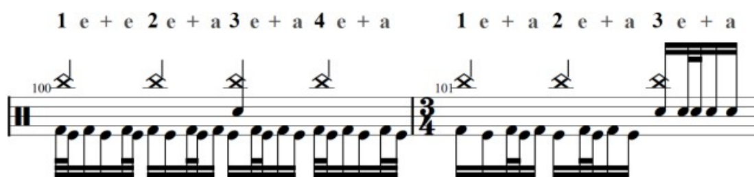
Gambar 9. Bar 100, Herta

Herta termasuk kedalam kategori hybrid rudiment , hybrid rudiment merupakan penggabungan antara dua atau lebih rudiment sehingga menghasilkan rudiment baru, hybird rudiment juga dapat dibentuk dengan mengubah nada aksen atau mengubah peletakan tangan dari rudiment dasar (Raz C, 2021).