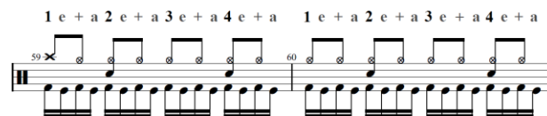
Gambar 2. Bar 59-60, Normal Time Feel/Backbeat

Seperti yang telah di singgung pada poin sebelumnya, terkait half time feel yang merupakan setengah pukulan snare dari yang biasanya, umumnya jika pukulan half time feel terdapat satu pukulan snare utama pada setiap satu bar, maka dari itu, pada pukulan normal time , terdapat dua pukulan snare utamadise tiap satu bar. Dikarenakan pukulan snare dalam teknik normal time biasanya jatuh pada ketukan kedua dan keempat, hal tersebut juga bisa dinamakan dengan teknik backbeat . Backbeat merupakan ketukan kedua dan keempat pada hitungan birama 4/4.