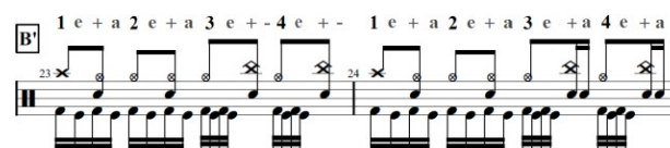
Gambar 3. Bar 23-24, Double Time Feel

Seperti teknik half time feel (Setengah) dan normal time feel , teknik double time feel adalah dua kali lipat pukulan snare dari teknik normal time feel , jika normal time feels terdapat dua pukulan snare dalam satu bar, maka doubletime feel terdapat empat pukulan snare dalam satu bar. Double time feel sering digunakan pada lagu Prahara Rusaking Jagad, dikarenakan didalam lagu tersebut terdapat unsur genre metal yang mempengaruhi kecepatan permainan drum dalam lagu tersebut.