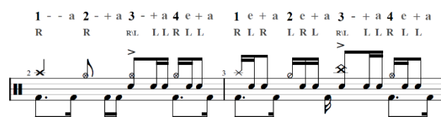
Gambar 1. Bar 2-3, Half Time Feel

Permainan drum diawali dengan teknik half time beat , atau pukulan paruh waktu. Teknik memainkan half time beat pada dasarnya terletak pada pukulan snare yang dimainkan setengah dari pukulan biasanya (Dalam satu bar beat drum , pukulan snare pada umumnya jatuh padaketukan kedua dan empat, namun dalam kasus half time beat , snare biasanya jatuh pada ketukan ketiga dan terkadang pada ketukan keempat.