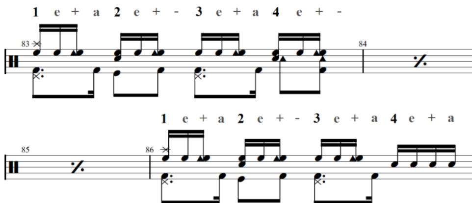
Gambar 10. Bar 83-86, Ostinato dan Independent