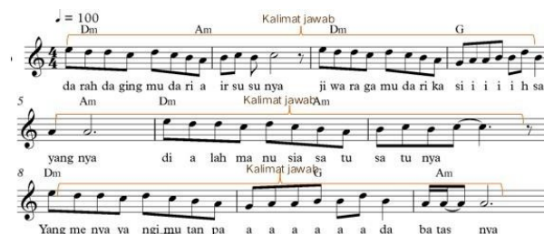
Gambar 2. Kalimat jawab Bagian A

Pada gambar di atas dimana peneliti menyebutnya sebagai kalimat tanya. Karena terdapat di awal kalimat, berada diantara bar 1-8, terdapat akor Dominan di bar 1 dan 4, berhenti dengan nada yang mengambang dan belum selesai, dinantikan bahwa lagu dilanjutkan di bar selanjutnya, dibangun dari 2(dua) motif irama dan diulang-ulang.