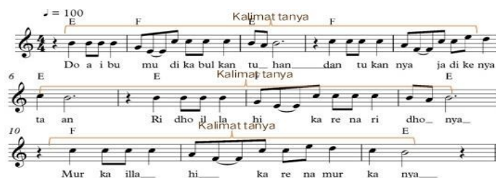
Gambar 3. Kalimat Tanya Pada Bagian B

Pada gambar di atas dimana peneliti menyebutnya sebagai kalimat tanya. Karena terdapat di awal kalimat, terdapat akor Dominan, berhenti dengan nada yang mengambang dan belum selesai, dinantikan bahwa lagu dilanjutkan di bar selanjutnya.