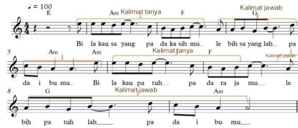
Gambar 4. Kalimat tanya dan jawab Bagian B