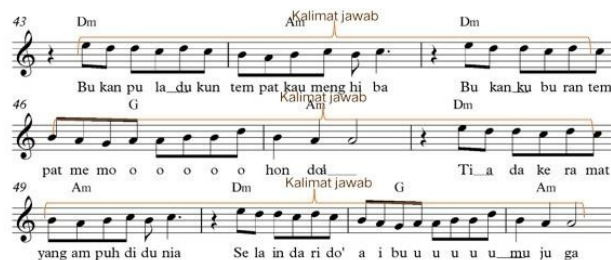
Gambar 6. Kalimat jawab Bagian A'

Gambar notasi di atas menunjukkan kalimattanya pada Bagian A' lagu Keramat. Pada gambar di atas dimana peneliti menyebutnya sebagai kalimat tanya. Karena terdapat di awalkalimat, dan terdapat akor Dominan, berhenti dengan nada yang mengambang dan belum selesai, dinantikan bahwa lagu dilanjutkan di bar selanjutnya, dibangun dari 2 (dua) motif irama dan diulang-ulang.