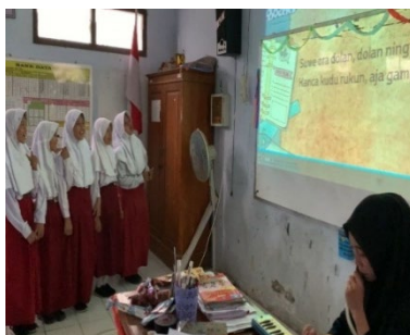
Gambar 2. Dokumentasi Siswa Berlatih Bersama Pianika

Berdasarkan hasil observasi selama proses pembelajaran, terjadi peningkatan signifikan dalam hal partisipasi dan antusiasme siswa. Sebelum penggunaan media pianika, siswa tampak pasif saat diminta membaca atau membuat parikan. Setelah penggunaan pianika, siswa menunjukkan keterlibatan aktif. Mereka saling berdiskusi, mencoba melodi, bahkan bereksperimen dengan irama.