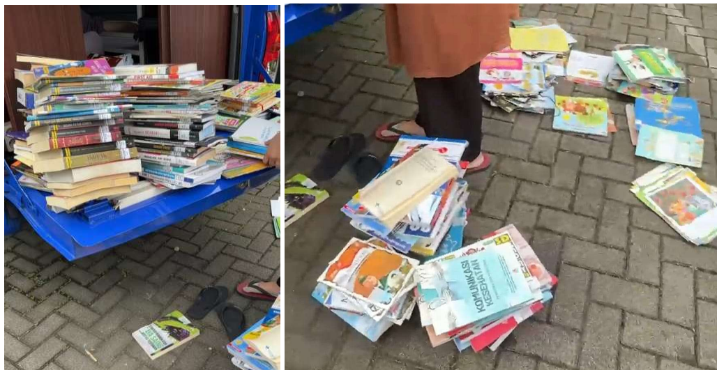
Gambar 2. Weeding Koleksi Perpustakaan Keliling

Gambar 2 menampilkan aktivitas mahasiswa dalam melakukan shelving dan penataan ulang koleksi. Dokumentasi ini menunjukkan keterlibatan mahasiswa dalam menerapkan standar klasifikasi dan penataan koleksi secara konsisten, sekaligus menjadi sarana pembelajaran kontekstual di lingkungan kerja nyata.