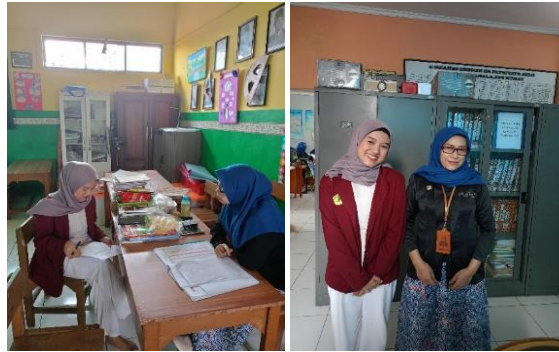
Gambar 1. Proses Wawancara Guru & Kepala Sekolah

pembelajaran bahasa. Kamus kecil ini berfungsi untuk memperkaya perbendaharaan kata peserta didik dan memfasilitasi pemahaman istilah-istilah penting dalam bahasa Indonesia. Kamus kecil ini berisi kata-kata baru yang ditemukan peserta didik dalam bahan bacaan mereka, lengkap dengan definisi dan contoh kalimat. Penggunaan kamus kecil ini dimodifikasi dengan teknologi, yaitu mengintegrasikan Kamus Besar Bahasa Indonesia (KBBI) online, yang mempermudah peserta didik mengakses makna kata secara cepat dan tepat. Dengan pendekatan ini, peserta didik tidak hanya memperluas kosakata mereka, tetapi juga dapat menerapkan kata-kata tersebut dalam komunikasi sehari-hari dengan cara yang tepat dan efektif.