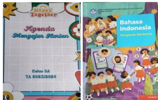
Gambar 2. Bahan dan Perangkat Pembelajaran

Dalam hal bahan ajar, pendidik menggunakan buku paket Bahasa Indonesia yang diterbitkan oleh Kementerian Pendidikan, Kebudayaan, Riset, dan Teknologi, serta lembar kerja peserta didik (LKS) yang mendukung pencapaian kompetensi dasar peserta didik. Selain itu, untuk menyesuaikan dengan kebutuhan spesifik kelas, Pendidik juga menggunakan jurnal harian sebagai modifikasi dari modul ajar yang telah disusun. Jurnal harian ini digunakan untuk menyesuaikan materi dengan kondisi peserta didik dan suasana belajar yang ada di kelas, memberikan keleluasaan dalam menerapkan pembelajaran yang lebih efektif. Penilaian dalam kurikulum merdeka bersifat holistik, yang tidak hanya mengukur pencapaian akademik, tetapi juga perkembangan kemampuan dan kompetensi peserta didik secara menyeluruh. Pendidik mengungkapkan bahwa dalam pembelajaran, ia menggunakan penilaian formatif untuk memantau kemajuan peserta didik secara berkala, serta penilaian sumatif di akhir semester untuk mengevaluasi pencapaian tujuan pembelajaran. Selain itu, penilaian juga melibatkan peserta didik dalam proses penilaian diri dan penilaian oleh teman sebaya, yang memungkinkan mereka memahami perkembangan belajar mereka sendiri.