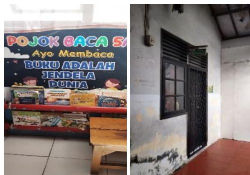
Gambar 4. Fasilitas Pojok Baca

Kegiatan pendukung di luar pembelajaran juga menjadi salah satu daya dukung penting dalam pengembangan keterampilan berbahasa produktif. Kepala sekolah, Kepala sekolah, mengimplementasikan berbagai aktivitas yang mendukung pengembangan karakter dan keterampilan peserta didik, seperti pembiasaan literasi melalui kegiatan membaca di pojok baca dan kegiatan agama yang rutin dilakukan. Kegiatan seperti JumTaq (Jumat Taqwa) dan senam bersama turut memperkaya pengalaman peserta didik dalam mengembangkan berbagai aspek keterampilan sosial dan kognitif yang mendukung pembelajaran bahasa. Pendidik kelas V, Pendidik, menambahkan bahwa di kelasnya, selain pembelajaran formal, terdapat pojok baca yang menjadi sarana bagi peserta didik untuk mengakses buku bacaan yang dapat memperkaya wawasan mereka. Pembiasaan membaca di luar jam pelajaran ini, menurut Pendidik, sangat berperan dalam meningkatkan keterampilan berbahasa produktif peserta didik, baik dalam aspek berbicara maupun menulis. Ibu E, pendidik kelas V B, juga mengungkapkan hal serupa dengan menekankan pentingnya kegiatan literasi yang diintegrasikan dalam kegiatan harian peserta didik. Namun, di SDN Serang 3 tidak ada ekstrakurikuler yang berkaitan mengenai keterampilan berbahasa yang seharusnya bisa menambah daya dukung dalam peserta didik belajar berbahasa.