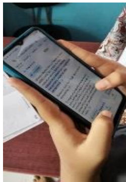
Gambar 5. Penggunaan KBBI Online oleh Guru