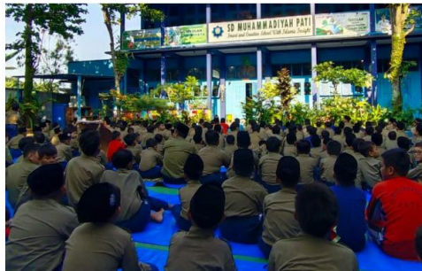
Gambar 2. Salat Dhuha Berjamaah (Implementasi Program Pembiasaan Pagi)