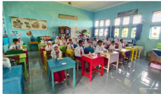
Gambar 8. Berdoa Bersama di Pagi Hari Sebelum Pembelajaran

Foto-foto tersebut memperlihatkan siswa yang sedang mengantre peminjaman buku di perpustakaan, melaksanakan kegiatan doa bersama di awal pembelajaran, serta mengikuti kegiatan MHK setelahnya di kelas masing-masing. Visualisasi ini semakin memperkuat bahwa pembiasaan pagi bukan hanya sekadar program tertulis, tetapi benar-benar diimplementasikan dalam kegiatan sehari-hari di sekolah. Bukti visual ini juga menunjukkan adanya konsistensi pelaksanaan program dari hari ke hari, yang mencerminkan komitmen sekolah dalam membentuk karakter dan tanggung jawab siswa melalui kegiatan rutin yang terarah.