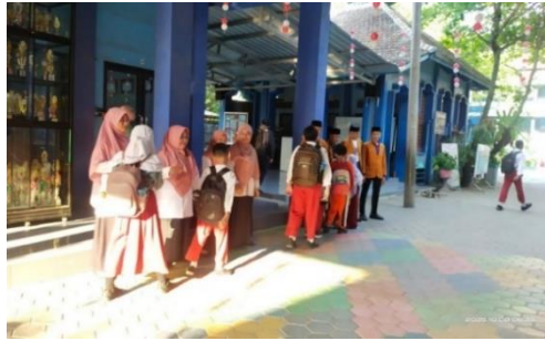
Gambar 1. Guru Menyambut Siswa (Implementasi Program 6S)