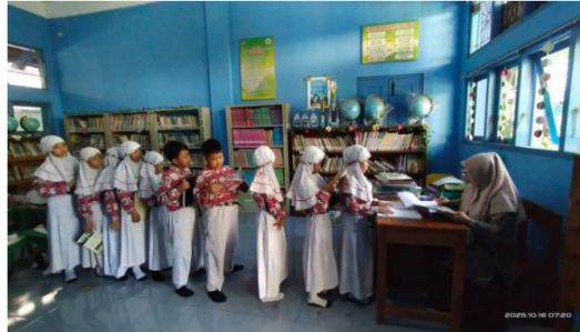
Gambar 7. Siswa Mengantre Meminjam Buku di Perpustakaan

kegiatan piket, dokumentasi memperlihatkan bagaimana siswa menjalankan tugas menyapu, merapikan meja, dan menyiapkan kelas dengan penuh kesadaran. Aktivitas ini menjadi bukti nyata bahwa pembiasaan pagi tidak hanya meningkatkan kedisiplinan, tetapi juga menumbuhkan rasa tanggung jawab siswa terhadap lingkungan belajarnya.