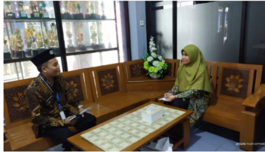
Gambar 3. Wawancara dengan Kepala Sekolah

Wawancara dengan kepala sekolah menunjukkan bahwa strategi utama sekolah dalam memperkuat nilai tanggung jawab siswa dilakukan melalui sosialisasi program sekolah, pembinaan berjenjang terhadap pelanggaran, dan pelaksanaan rapat rutin setiap pekan untuk memperkuat komitmen guru.