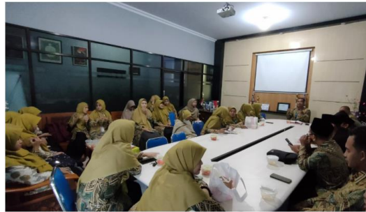
Gambar 4. Rapat Rutin dengan Kepala Sekolah

Kepala sekolah menekankan pentingnya komunikasi aktif dengan orang tua serta konsistensi pelaksanaan program oleh seluruh tenaga kependidikan. Sementara itu, guru menjelaskan bahwa strategi yang mereka gunakan meliputi pemberian teladan, penegakan aturan dengan konsekuensi logis, dan penyampaian batasan yang jelas kepada siswa sesuai tahap perkembangan mereka. Hasil wawancara memperkuat temuan tersebut. Kepala sekolah menyampaikan bahwa,