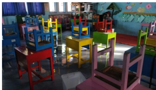
Gambar 5. Kesadaran Piket Kelas Siswa

Dokumentasi sekolah menunjukkan keberadaan program-program pembiasaan pagi yang tercantum dalam jadwal kegiatan harian, termasuk MHK, literasi numerasi, piket kelas, dan jadwal kunjungan perpustakaan. Selain itu, terdapat dokumen administrasi peminjaman buku, jadwal salat dhuha, serta struktur organisasi guru pendamping ibadah dan polisi ibadah.