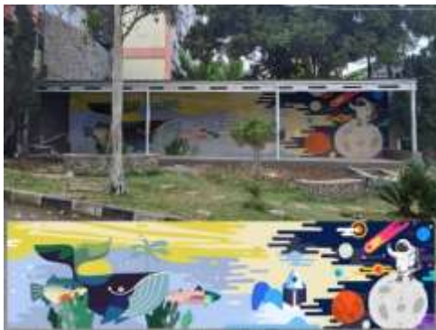
Gambar 4 Desain Mural di “Taman Literasi”