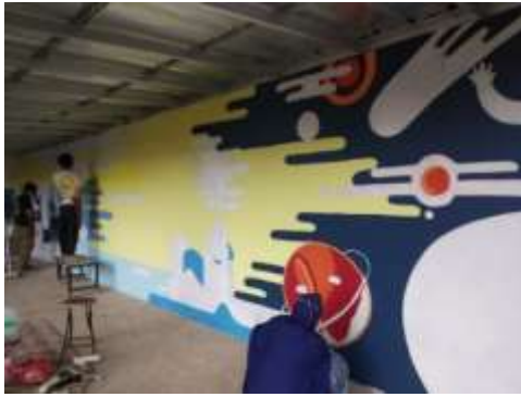
Gambar 3 Melukis Mural