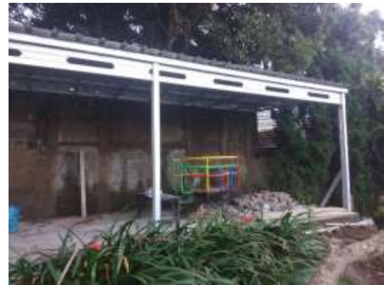
Gambar 2 Perombakan dan Pendirian “Taman Literasi”