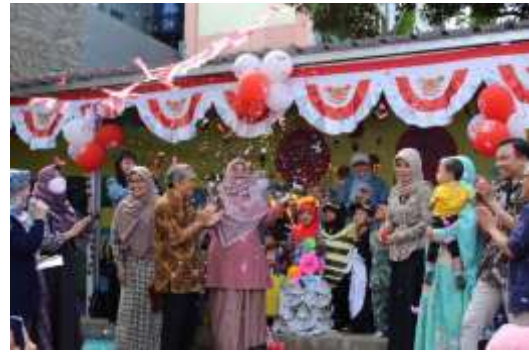
Gambar 4 Peresmian “Taman Literasi”