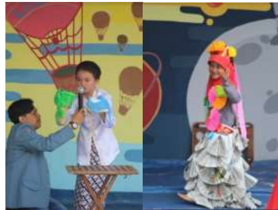
Gambar 5 Lomba Mendongeng dan Kostum Anak