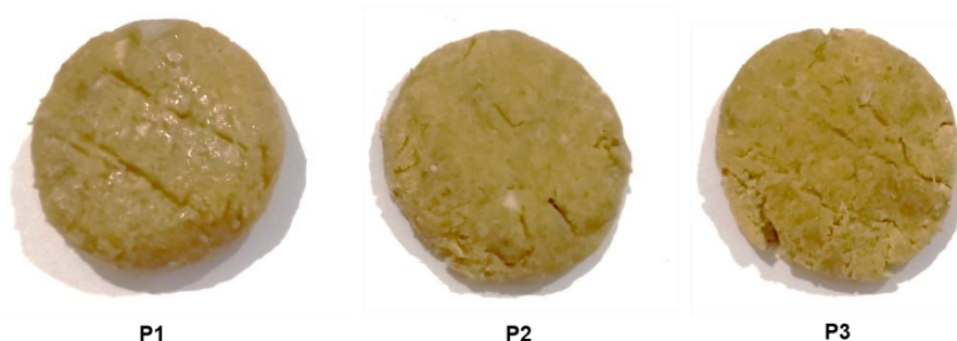
Gambar 1. Produk patty analog berbasis nangka muda dan ampas tahu

Pengujian sensoris patty analog berbasis nangka muda dan ampas tahu disajikan dalam Gambar 2.