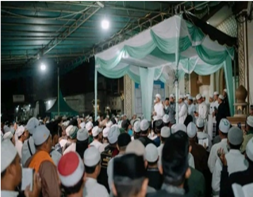
Gambar 1. Majelis Ta'lim Laki-Laki

Dan berikut ini adalah beberapa dokumentasi kegiatan majelis ta'lim yang pernah dilakukan di Masjid Al-Jami'atussabab, sebagaimana pada gambar di bawah ini: