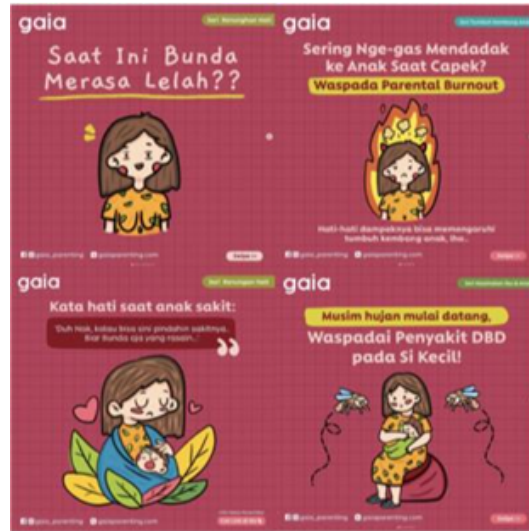
Gambar 2. Pose Desain Karakter

konten yang disampaikan. Sedangkan untuk proporsi tubuhnya menggunakan proporsi empat kepala. Penerapan pose dan ekspresi desain karakter Gaya Parenting sendiri menyesuaikan dengan tema dan judul konten yang disampaikan seperti pada gambar 2.