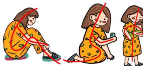
Gambar 6. Pose Desain Karakter

Pose berguna untuk menekankan ketiga prinsip lainnya pada karakter, sehingga karakter terkesan hidup dan meyakinkan. Pose harus digambarkan secara jelas, dalam artian pose tidak memiliki makna ganda. Pose yang baik memiliki line of action yang dinamis. Line of action adalah garis imajiner yang merupakan aksi utama dari karakter (Blair, 1949:5). Penggunaan line of action akan menambahkan kesan dramatis pada pose desain karakter. Berikut beberapa contoh tampilan visual desain karakter Gaya Parenting . Penggunaan line of action yang baik dan kuat biasanya memiliki bentuk garis yang melengkung, penggunaan line of action juga dapat menggunakan lebih dari satu garis untuk memberikan keseimbangan visual. Pose desain karakter Gaya Parenting sendiri memiliki beberapa pose yang sering digunakan, dari unggahan sepanjang tahun 2021 ada tiga macam pose yang digunakan, yakni pose berdiri dengan sedikit membungkuk, pose duduk sejajar dengan anak dan pose meringkuk. Jika dilihat dari pose-pose yang digunakan, desain karakter Gaya Parenting kurang mempresentasikan desain karakter yang ceria, bebas dan aktif. Hal ini dikarenakan pose-pose yang masih terbatas.