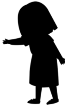
Gambar 3. Desain Karakter Siluet

Silhouette sendiri merupakan outline (gambaran umum) dari sebuah karakter. Karakter harus memiliki keunikan tersendiri yang membuatnya terlihat berbeda dengan karakter yang telah ada. Silhouette juga akan membuat karakter lebih mudah dikenali. Silhouette desain karakter Gaya Parenting dapat diidentifikasi sebagai sosok karakter perempuan dengan rambut pendek, bentuk tubuhnya terlihat cukup jelas, dan pose nya dapat terbaca dengan mudah serta dapat dibedakan dengan desain karakter lain. Desain karakter Gaya Parenting dapat dikenali karena memiliki bentuk kepala serta rambut yang khas yakni pendek sebah dan memakai atribut pakaian daster yang ditampilkan cukup jelas dari silhouette .