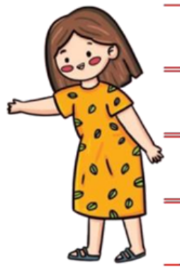
Gambar 4. Shape Desain Karakter

Proporsi ini merupakan proporsi umum yang biasa digunakan untuk menggambarkan sosok manusia, namun dari proporsi ini desain karakter Gaya Parenting menunjukkan personality yang umum. Personality yang umum biasanya digunakan pada karakter utama (Lewis, 2018). Proporsi tubuh desain karakter Gaya Parenting memberikan makna keterbukaan, ramah dan kelembutan.