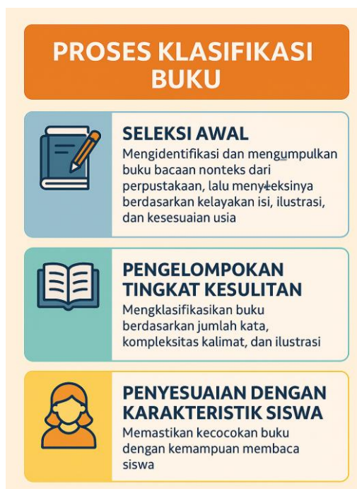
Gambar 2. Proses Klasifikasi Buku

Berdasarkan klasifikasi tersebut, peneliti mengelompokkan buku-buku bacaan nonteks di perpustakaan sesuai dengan jenjang kemampuan siswa. Penentuan jenjang ini menjadi dasar dalam pemilihan dan penggunaan buku selama kegiatan membaca, sebagai strategi untuk menumbuhkan minat baca secara bertahap dan berkelanjutan. Proses klasifikasi buku dilakukan melalui beberapa tahapan berikut: