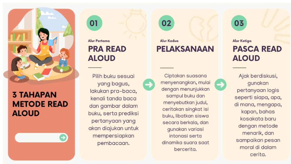
Gambar 3 Tahapan Metode Read Aloud

Adapun tahapan read aloud yang dilakukan peneliti pada saat treatment ada tiga tahap pokok, yaitu persiapan untuk melakukan read aloud , pembacaan isi buku, dan diskusi pasca pembacaan. (Ifadah & Irayana, 2023).