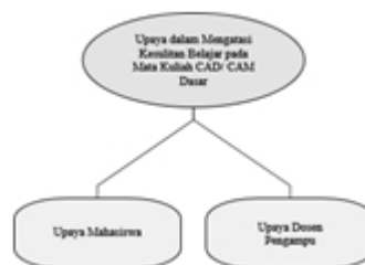
Gambar 4. Mind Map Upaya dalam Mengatasi Kesulitan Belajar pada Mata Kuliah CAD/CAM dasar

Setelah menganalisis faktor kesulitan, peneliti memfokuskan aspek spesifik materi pembelajaran yang sulit dipahami oleh mahasiswa. Tiga Komponen materi yang diidentifikasi sebagai tantangan utama adalah : Gambar Kerja, Koordinat dan UCS ( User Coordinate System )