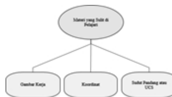
Gambar 3. Mind Map Materi yang sulit dipelajari

Faktor kesulitan yang dialami mahasiswa dalam memahami mata kuliah CAD/CAM dasar dapat diidentifikasi menjadi beberapa bagian, yaitu latar belakang pendidikan, kemampuan, ketersediaan fasilitas pribadi, akses terhadap modul dan waktu yang terjadwal.