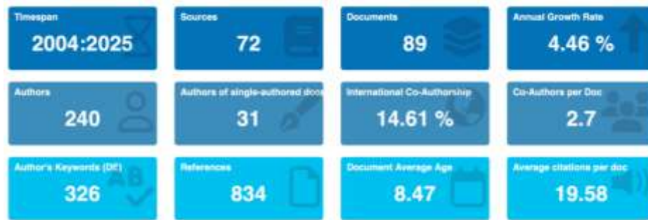
Gambar 1. Overview Proses Analisis

Berdasarkan analisis awal Systematic Literature Review SLR yang dilakukan menggunakan data bibliometrik, kajian terkait topik ini menunjukkan perkembangan yang relatif konsisten dalam kurun waktu 2004 hingga 2025 dengan tingkat pertumbuhan publikasi tahunan sebesar 4,46 persen. Selama periode tersebut, teridentifikasi 89 dokumen ilmiah yang dipublikasikan pada 72 sumber berbeda dan ditulis oleh 240 penulis, yang mencerminkan karakter kajian yang bersifat multidisipliner dan tersebar lintas jurnal. Pola kolaborasi penulis tergolong moderat dengan rata-rata 2,7 penulis per dokumen, meskipun tingkat kolaborasi internasional masih relatif terbatas sebesar 14,61 persen. Dari sisi dampak ilmiah, dokumen dalam korpus literatur ini memiliki rerata sitasi yang cukup tinggi yaitu 19,58 sitasi per artikel, dengan usia dokumen rata-rata 8,47 tahun, yang mengindikasikan bahwa tema kajian ini telah berkembang secara berkelanjutan dan memiliki basis literatur yang mapan. Selain itu, keberagaman kata kunci penulis yang mencapai 326 istilah menunjukkan luasnya spektrum pendekatan dan fokus penelitian, sehingga menegaskan relevansi topik ini sebagai bidang kajian yang terus berkembang dan layak untuk dianalisis lebih lanjut secara tematik dan konseptual.