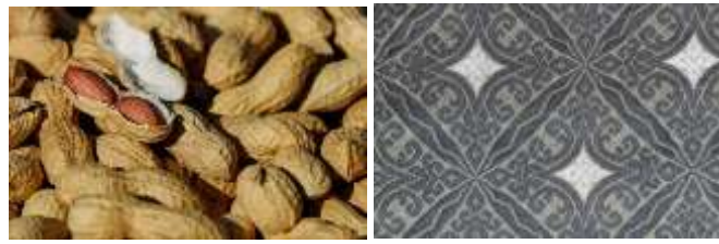
Gambar 12. Motif Balah Kacang pada galeri Ceno Songket di Silungkang

melupakan asal-usulnya, serta menjadi salah satu ciri visual khas songket Silungkang yang tetap dipertahankan hingga kini.