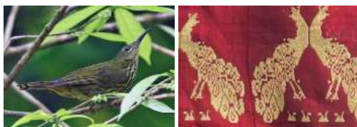
Gambar 5. Motif Buruang dalam Rimbo pada galeri Ceno Songket di Silungkang

Motif Buruang Dalam Rimbo merupakan motif klasik songket Silungkang yang telah diwariskan secara turun-temurun. Motif ini menampilkan stilasi burung kecil dengan sayap terbuka yang dikelilingi ornamen menyerupai hutan, ditenun menggunakan benang emas sebagai simbol kemewahan dan kehormatan. Hingga kini, motif ini masih diproduksi dengan penyesuaian pola dan warna agar tetap relevan dengan selera masa kini tanpa menghilangkan ciri khas aslinya.