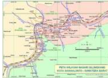
Gambar 1. Peta Wilayah Nagari Silungkang

Nagari Silungkang merupakan wilayah di Kecamatan Silungkang, Kota Sawahlunto, Provinsi Sumatera Barat, yang terletak di bagian timur Sumatera Barat dengan luas sekitar 32,93 km 2 dan jumlah penduduk yang mencerminkan dinamika sosial yang cukup padat. Secara administratif, nagari ini terbagi ke dalam lima desa, dengan Silungkang Duo berperan sebagai desa wisata yang mendukung pengembangan budaya lokal. Letak geografis Silungkang yang berbatasan dengan sejumlah wilayah di Kota Sawahlunto dan Kabupaten Sijunjung membentuk keterhubungan sosial, ekonomi, dan budaya antarnagari. Selain itu, Nagari Silungkang memiliki nilai historis dan kultural yang kuat sebagai sentra kain songket Minangkabau yang diwariskan secara turun-temurun sejak sekitar abad ke-6, seiring perpindahan leluhur dari Pariangan atau Padang Panjang. Tradisi menenun tersebut berkembang dari industri rumah tangga hingga mencapai masa kejayaan perdagangan pada awal abad ke-20, sementara beragam cerita lisan mengenai asal-usul nama Silungkang mencerminkan kekayaan memori kolektif masyarakat. Dengan demikian, Nagari Silungkang tidak hanya memiliki signifikansi geografis, tetapi juga berperan penting sebagai pusat pelestarian warisan budaya dan identitas masyarakat Minangkabau.