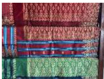
Gambar 2. Sarung Songket Silungkang Pada Galeri Ceno Songket

Sarung songket Silungkang merupakan produk utama Galeri Ceno Songket yang memiliki nilai budaya dan historis tinggi. Pada masa lalu, sarung songket hanya