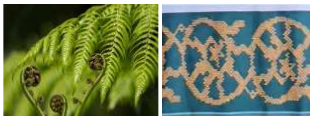
Gambar 9. Motif Kaluak Paku pada galeri Ceno Songket di Silungkang

songket pengantin wanita Silungkang sebagai elemen visual penting yang ditempatkan di bagian tengah atau tepi kain.