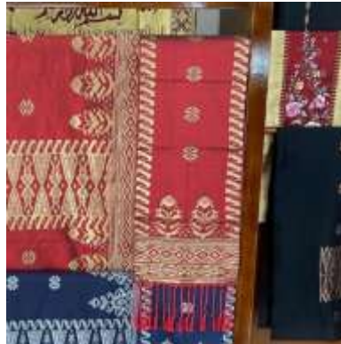
Gambar 3. Selendang Songket Silungkang Pada Galeri Ceno Songket

Selendang songket Silungkang berfungsi sebagai pelengkap busana tradisional dan busana modern. Dahulu, selendang lebih banyak digunakan dalam acara adat dengan warna dan motif yang disesuaikan dengan sarung songket agar tampak serasi. Saat ini, selendang berkembang menjadi produk yang fleksibel dan digunakan pada berbagai acara formal maupun nonadat, dengan pilihan warna yang lebih lembut seperti pastel, krem, abu-abu, dan ungu muda. Perbedaan kualitas dan nilai ekonomi selendang ditentukan oleh bahan serta kerapatan tenunan, sementara teknik pembuatan tetap menggunakan alat tradisional. Perkembangan ini menunjukkan bahwa selendang songket Silungkang mampu beradaptasi secara estetis tanpa meninggalkan nilai tradisi dan identitas budaya lokal.