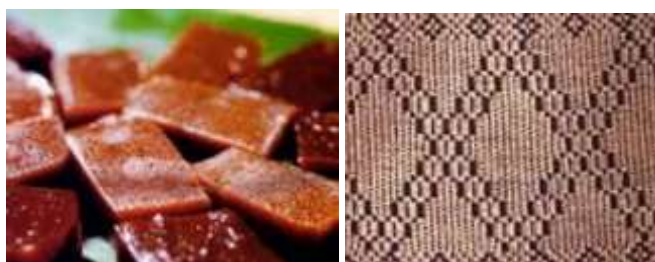
Gambar 10. Motif Saiak Galamai pada galeri Ceno Songket di Silungkang

Motif Saik Galamai merupakan ragam hias geometris berbentuk jajar genjang dan segi empat yang terinspirasi dari potongan makanan tradisional Minangkabau, yaitu galamai. Motif ini mencerminkan kreativitas pengrajin dalam mengangkat unsur keseharian menjadi ornamen tekstil songket Silungkang.