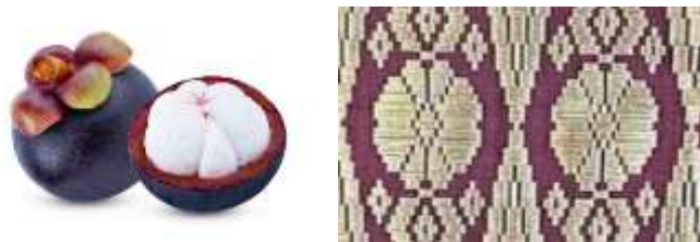
Gambar 8. Motif Tampuak Manggih pada galeri Ceno Songket di Silungkang

Motif Tampuak Manggih merupakan motif klasik yang ditunen secara berulang dengan pola berbentuk bunga, terinspirasi dari buah manggis. Motif ini diwariskan secara turun-temurun dan memiliki keterkaitan historis dengan ragam hias yang juga ditemukan pada relief Candi Prambanan abad ke-9 dan ke-10.