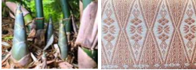
Gambar 6. Motif Pucuk Rabuang pada galeri Ceno Songket di Silungkang

Motif Pucuk Rabuang atau Tunas Bambu terinspirasi dari bambu yang memiliki filosofi mudo baguno, tuo tapakai . Motif ini menjadi identitas penting songket Silungkang dan hampir selalu hadir dalam setiap pembuatan kain, sehingga tetap dipertahankan oleh para penenun hingga sekarang.