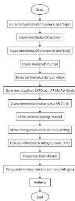
Gambar 2. Skenario Pembelajaran