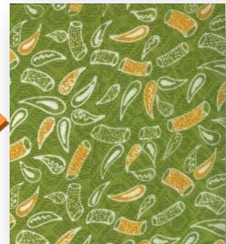
Gambar 2.5 Awi Bitung (dokumen penulis)