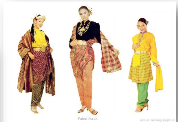
Gambar 2.10 Busana tradisional Aceh