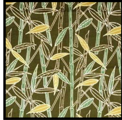
Gambar 2.1 Bambu