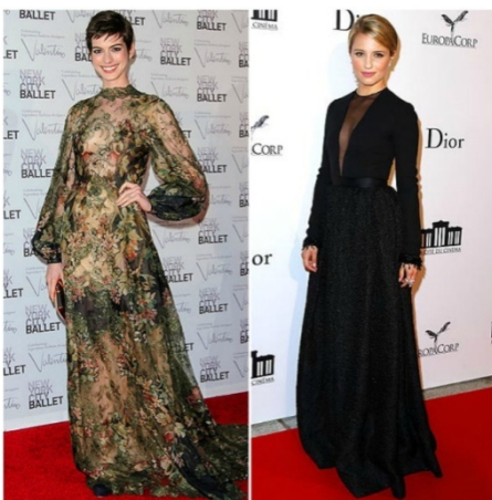
Gambar 2.8 Awards Gown

Saat ini, para pelaku entertaint yang juga mengenakan kerudung berusaha menampilkan busana muslimah yang menarik dan elegant . Penggunaan busana muslimah semakin berkembang sehingga membuat para artis memilih berbagai alternatif untuk berbusana muslim termasuk dalam Busana kesempatan award .