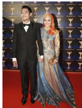
Gambar 2.9 Awards Fashion