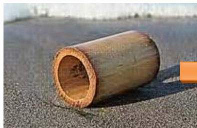
Gambar 2.4 Potongan bambu