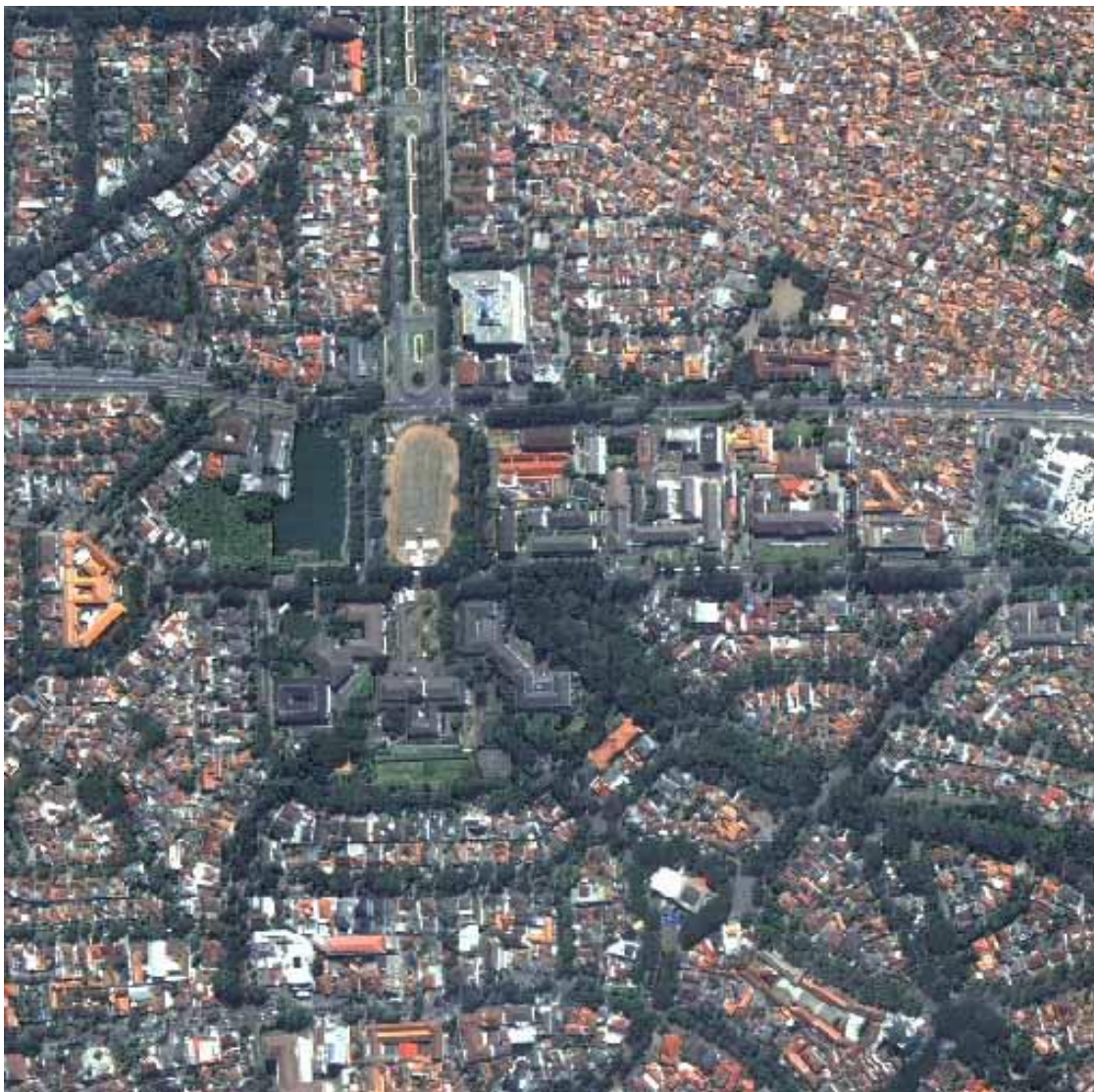
Gambar 1. Citra Quickbird Wilayah Cibunying Kota Bandung

Bahan dan alat yang digunakan dalam penelitian ini, yaitu sebagai berikut: 1) Citra Quickbird daerah Kota Bandung hasil perekaman tanggal 8 Agustus 2008, merupakan data utama dalam penelitian ini; 2) Peta Administrasi Kota Bandung Tahun 2010; 3) Perangkat lunak berupa software Arc View 3.3 untuk digitasi dan analisis; 4) Perangkat lunak berupa software Mapinfo 7.0 untuk layout peta; Alat survey digunakan berupa tabel interpretasi, alat tulis, Global Position Sistem (GPS).