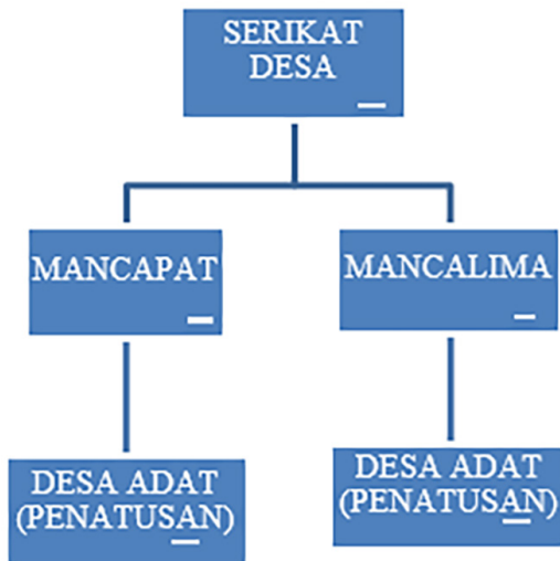
Bagan 1. Pembagian Wilayah Desa di Jawa-Madura Sebelum 1900-1926

Sumber: Eindverslag over het desa-autonomie-onderzoek op Java en madoera