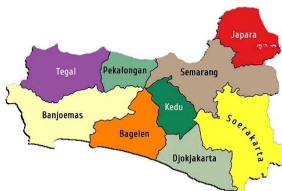
Gambar 1. Peta Keresidenan Banyumas dan sekitarnya 1903

Perubahan sosial-politik selama reorganisasi pemerintahan merupakan tantangan seorang elit, ketika penatus yang pada awalnya merupakan aristokra lokal menjadi seorang pegawai kolonial (Best & Hoffmann-Lange, 2018). Apalagi yang menjadi sasaran J. Mulemeister adalah masalah kepegawaian beserta elit lokal. Maka dari itu, dijelaskan alasan reformasi wilayah menjadi salah satu pemberi dampak terhadap elit penatus dan sistem desa adatnya.