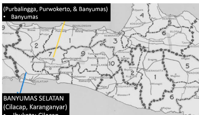
Gambar 3. Peta Keresidenan Banyumas dan Sekitarnya circa 1930

Penyebutan desa-desa bersistem kesepuhan di Jawa tentunya memiliki istilah yang berbeda-beda. Kesepuhan disini, mengacu pada pendapat Vollenhoven merupakan elit desa tingkat menengah kebawah serta memiliki gelar yang berbeda-beda. Di daerah Banten, Tegal dan Rembang, kesepuhan desa mereka dikenal sebagai Lurah. Daerah pantura lain seperti Cirebon, Surabaya, Pasuruan dan Besuki disebut sebagai Aris, sedangkan Madiun dan Kediri disebut Palang-kepalang (Laceulle, 1929, hlm. 5). Terdapat 3 daerah pengecualian yang memiliki penyebutan kesepuhan berbeda, yaitu Bagelen, Semarang, dan Banyumas. Kesepuhan desa di Semarang bernama Panglawe, untuk Bagelen bernama Glondong dan Banyumas disebut sebagai Penatus.