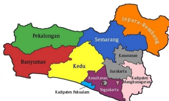
Gambar 2. Peta Keresidenan Banyumas dan Sekitarnya pasca reformasi wilayah 1935