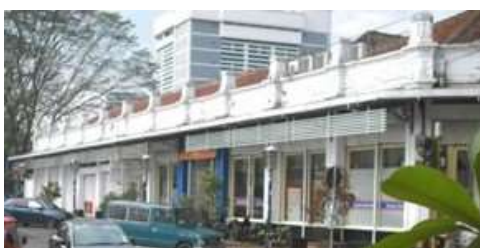
Gambar 1. Fasad bangunan sebelum dialihfungsikan menjadi Starbucks Asia Afrika

Berdasarkan aturan pemugaran pada pasal 77 UU Nomor 11 Tahun 2007 yang mengharuskan tingkat perubahan sekecil mungkin dan mempertahankan keaslian bahan, bentuk, dan pengayaan, bangunan alihfungsi ini tetap mempertahankan bentuk dan gaya bangunan apa adanya sejak masih berfungsi sebagai ritel farmasi (kimia farma), fasad dengan gaya kolonial berjendela besar yang berjajar masih dipertahankan, sehingga menonjolkan aktivitas yang berada di dalam maupun di luar bangunan. Jendela dengan ukuran besar dan lebar memberikan kesan kokoh pada bangunan dan menunjukkan bahwa bangunan tersebut adalah bangunan peninggalan kolonial. Meskipun fasad memiliki gaya kolonial, namun interior pada bangunan ini menyesuaikan dengan brand identity yang dimiliki oleh Starbucks yaitu gaya modern bertema urban agar penggunaannya yang saat ini sebagian besar adalah masyarakat urban merasa nyaman dengan desain ruang yang lebih sesuai kebutuhannya saat ini.