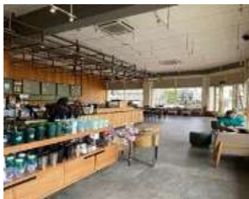
Gambar 3. Penampakan lantai, dinding, dan plafon Starbucks Asia Afrika

Sebagai sebuah presentasi ruang, penting bagi ritel untuk mengoptimalkan desain dari ketiga elemen interior, yaitu lantai, dinding, dan plafon. Sebuah ritel membutuhkan presentasi ruang yang kreatif, inovatif, namun sederhana, sehingga pembeli atau pengunjung tetap fokus kepada produk yang dijual. Dalam melakukan revitalisasi bangunan cagar budaya ini, elemen utama interior bangunan yang telah ada semaksimal mungkin dipertahankan. Pihak Starbucks hanya melakukan beberapa perbaikan pada elemen yang sudah rusak dan melakukan pelapisan finishing untuk memunculkan tema atau penggayaan desain yang diinginkan. Desain yang sederhana dari sebuah ritel juga memberikan keuntungan kepada para pelaku bisnis dalam melakukan visual merchandising yang menarik dengan budget yang minim, sehingga dapat membangun citra brand yang baik (Iqbal Habiba Umer Aisha Maqbool Namrata Sunil R Pillai et al., 2011).