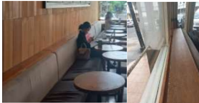
Gambar 7. Furnitur Built-In pada Starbucks Asia Afrika

Dalam melakukan perancangan dan penyusunan furnitur, Starbucks Asia Afrika menerakan beberapa jenis furnitur, yaitu jenis loose dan built-in . Penggunaan furnitur loose akan mempermudah pemindahan dan tidak memerlukan perlakuan khusus karena tidak berhubungan langsung dengan eksisting bangunan, namun untuk furnitur dengan jenis built in seperti tempat duduk panjang, diperlukan pelakuan khusus dengan tidak menghubungkannya langsung pada dinding eksisting. Oleh karena itu, Starbucks mengakalinya dengan menyambungkan furnitur tersebut kepada panel kayu yang juga berfungsi sebagai finishing dinding. Hal ini dilakukan untuk meminimalisir kerusakan pada bangunan sesuai dengan aturan undang-undang yang berlaku mengenai pemugaran cagar budaya.