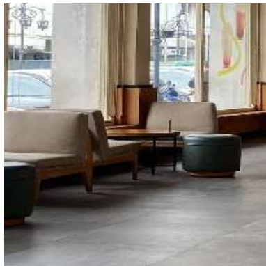
Gambar 8. Furnitur Loose pada Starbucks Asia Afrika

Seluruh furniture pada bangunan Starbucks Asia Afrika ini merupakan furnitur dengan gaya modern kontemporer yang terlihat dari kursi kayu yang minimalis, sofa, coffee table , dan artwork pada dinding. FURNITUREnya juga didominasi dengan material kayu dengan tambahan pouf pada setiap dudukannya untuk menambah kenyamanan saat digunakan. Bentuk furnitur yang ada pada dalam bangunan memiliki bentuk yang beragam dengan berbagai varian geometri lengkung, persegi, dan lingkaran. Material pada furnitur tersebut mendukung desain yang digunakan oleh Starbucks Asia Afrika untuk menciptakan kesan hangat dan