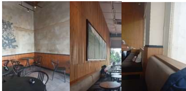
Gambar 5. Dinding Starbucks Asia Afrika

Pada bagian plafond terdapat penambahan unit AC Cassete sebagai penunjang penghawaan buatan pada ruangan yang didominasi dengan gypsum kotak – kotak berwarna putih. Sedangkan lampu yang digunakan untuk pencahayan buatan peletakkannya digantung menggunakan stainless steel sehingga tidak menempel pada gysum plafond. Penggunaan lampu LED berwarna warm white digunakan oleh Starbuck Asia Afrika sebagai upaya mengurani konsumsi energi. Warna lampu ini juga memberikan kesan hangat dan nyaman kepada pengunjungnya saat menikmati sajian dengan suasana yang mendukung dan pelayanan yang ramah. Selain itu, CCTV juga pemasangannya menggunakan teknik digantung dikarenakan desain dari plafond masih asli dan hanya diganti beberapa materialnya dikarenakan sudah rusak.