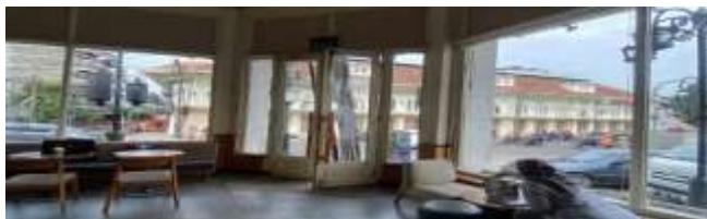
Gambar 2. Pemanfaatan fasad jendela kaca besar Starbucks Asia Afrika

Jendela besar transparan yang menonjol pada fasad dan menghadap kawasan bangunan heritage di sekitarnya juga memberikan manfaat bagi Starbucks dengan memberikan pengunjung pemandangan dan pengalaman unik yang jarang ditawarkan oleh ritel F&B ( Food & Beverages ) lainnya. Calon pengunjung yang ada di sekitar bangunan akan membayangkan pengalaman menikmati produk Starbucks sambil dikelilingi bangunan bergaya kolonial. Hal inilah yang menjadi keunikan tersendiri bagi para pengunjung, khususnya wisatawan yang baru berkunjung ke Bandung dan akhirnya tertarik untuk masuk ke dalamnya. Secara garis besar, jendela kaca besar yang juga sekaligus berfungsi sebagai window display dari ritel ini membawa manfaat sebagai elemen eksterior dan menjadi salah satu bagian penting dalam hal marketing (Iqbal Habiba Umer Aisha Maqbool Namrata Sunil R Pillai et al., 2011).