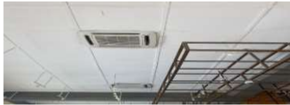
Gambar 4. Plafon Starbucks Asia Afrika

Pada bagian plafond terdapat penambahan unit AC Cassete sebagai penunjang penghawaan buatan pada ruangan yang didominasi dengan gypsum kotak – kotak berwarna putih. Sedangkan lampu yang digunakan untuk pencahayan buatan peletakkannya digantung menggunakan stainless steel sehingga tidak menempel pada gysum plafond. Penggunaan lampu LED berwarna warm white digunakan oleh Starbuck Asia Afrika sebagai upaya mengurani konsumsi energi. Warna lampu ini juga memberikan kesan hangat dan nyaman kepada pengunjungnya saat menikmati sajian dengan suasana yang mendukung dan pelayanan yang ramah. Selain itu, CCTV juga pemasangannya menggunakan teknik digantung dikarenakan desain dari plafond masih asli dan hanya diganti beberapa materialnya dikarenakan sudah rusak.