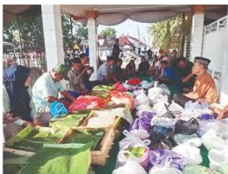
Gambar 3. Upacara Nyadran

Tradisi budaya Kotagede tidak jauh dari pengaruh agama Islam, sebagai contoh yakni Upacara Nyadran. Menurut (Dimiyati, 2024) upacara ini dianggap sebagai bentuk penghormatan dan ungkapan rasa syukur terhadap jasa dan kontribusi leluhur dalam mendirikan Kerajaan Mataram. Dalam penelitiannya dijelaskan bahwa gerakan, doa, dan simbol dalam ritual Nyadran tidak hanya dilihat sebagai tradisi turun-temurun, tetapi juga sebagai bentuk pengabdian dan komunikasi dengan dunia roh. Penggunaan bahasa Jawa sebagai bahasa pengantar dalam transaksi jual beli dan aktivitas sehari-hari juga masih dilestarikan. Hal ini menunjukkan bahwa bahasa Jawa masih menjadi bagian penting dari identitas budaya masyarakat Kotagede. Selain itu, Pasar Legi juga menjadi tempat bagi masyarakat untuk mempraktikkan tradisi gotong royong. Para pedagang dan pembeli saling membantu dan bekerja sama dalam menjaga kebersihan dan ketertiban pasar. Tradisi ini mencerminkan nilai-nilai kebersamaan dan solidaritas yang masih dijunjung tinggi oleh masyarakat Kotagede.