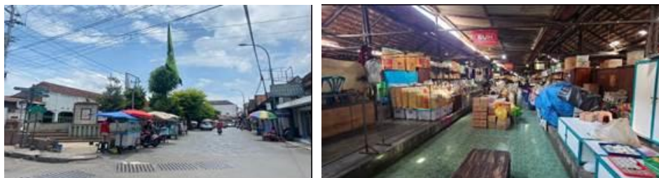
Gambar 1.2. Suasana di sekitar Pasar Legi Kotagede, pasar tradisional tertua di Kota Yogyakarta.

rapi, menciptakan suasana pasar yang teratur dan mudah dijelajahi. Lorong-lorong yang lebar memungkinkan pengunjung untuk bergerak dengan leluasa, sementara area terbuka di tengah pasar menjadi tempat berkumpul dan berinteraksi bagi para pedagang dan pembeli.