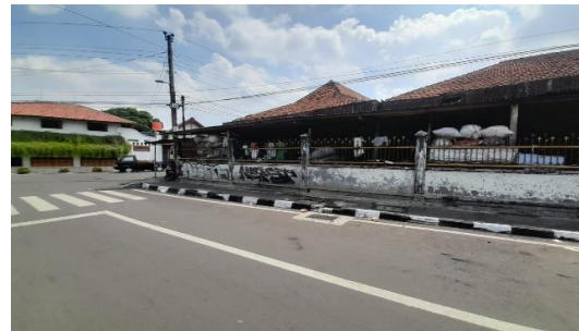
Gambar 1. Bangunan Pasar Legi Kotagede

Lantai pasar yang terbuat dari tegel kunci, dengan motif geometris yang khas, semakin memperkaya estetika bangunan. Tegel kunci merupakan material lantai yang populer pada masa kolonial, dan penggunaan tegel kunci di Pasar Legi menunjukkan pengaruh gaya arsitektur Eropa pada bangunan ini. Selain itu, penggunaan material lokal seperti batu bata dan kayu pada dinding dan struktur bangunan juga mencerminkan kearifan lokal dalam memanfaatkan sumber daya alam yang tersedia. Keunikan arsitektur Pasar Legi tidak hanya terletak pada perpaduan gaya Jawa dan kebudayaan peninggalan Belanda, tetapi juga pada tata ruangnya yang terbuka dan fungsional. Pasar ini terdiri dari beberapa los yang berderet