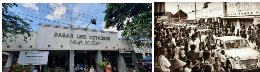
Gambar 2. Pasar Legi Kotagede 2024 dan 1971

Bahasan budaya dalam hal ini mengacu pada elemen-elemen Penerapan Catur Gatra Tunggal di Kotagede mencerminkan bagaimana budaya itu berlangsung sejak dulu. Kusumawati (2018) dalam jurnalnya "Pasar Kotagede: Identitas Budaya dan Daya Tarik Wisata" menjelaskan bahwa Pasar Legi Kota Gede telah menjadi bagian dari identitas budaya masyarakat Kotagede. Pasar ini menjadi simbol kearifan lokal dan nilai-nilai budaya yang diwariskan dari generasi ke generasi. Keberadaannya menarik wisatawan lokal maupun mancanegara untuk berkunjung dan merasakan atmosfer budaya Kotagede yang unik dan autentik. Pasar Legi Kotagede adalah tempat di mana dinamika interaksi budaya terjadi setiap hari. Pedagang dari berbagai latar belakang budaya berinteraksi dengan pembeli yang datang dari berbagai daerah. Proses tawar-menawar, pertukaran pengetahuan tentang produk, dan pembelajaran bahasa-bahasa yang berbeda menjadi contoh konkrit dari bagaimana inklusivitas budaya terwujud dalam aktivitas sehari-hari di pasar ini (Primayudi et al., 2015).