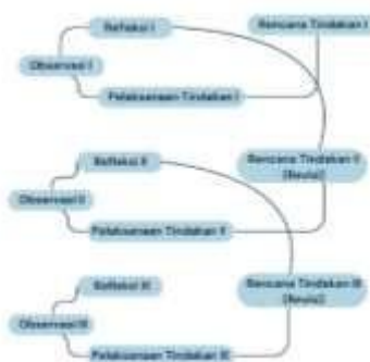
Gambar 1. Alur Penelitian Tindakan Kelas Kemmis dan Mc Taggart

Partisipan penelitian ini terdiri dari 1 orang guru dan 28 orang siswa kelas IV pada salah satu SD Negeri yang berada di Kabupaten Bandung Barat. Teknik pengumpulan data yang digunakan adalah observasi, tes, dan format dokumen. Adapun instrumen yang digunakan adalah lembar observasi, lembar instrumen tes, dan dokumentasi.