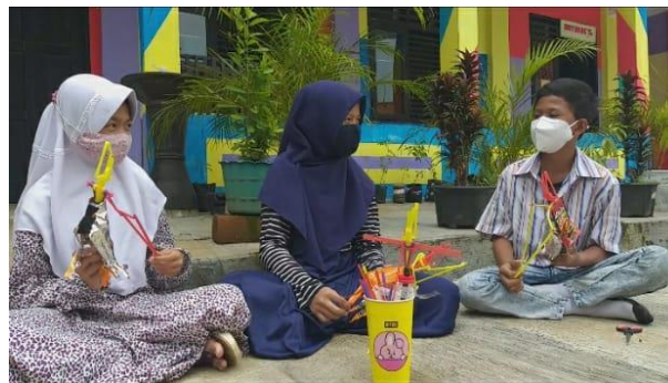
Gambar 4. Pelibatan Siswa pada Tahap Pra Kegiatan

Kegiatan webinar “Meningkatkan Kreativitas Seni Siswa SD di Masa Pandemi Melalui Pemanfaatan Barang Bekas di Rumah” yang telah dilaksanakan, menjadi alternatif pembelajaran seni musik dan kerajinan tangan pada kondisi pembelajaran daring. Siswa masih tetap dapat mempelajari kesenian dengan suasana yang menyenangkan, di antaranya belajar mempraktikkan ketukan irama dan membuat macam-macam karya seni melalui pemanfaatan barang bekas yang mudah ditemukan di sekitar rumah. Kegiatan tersebut telah berhasil meningkatkan semangat belajar seni dalam diri siswa. Hal itu terbukti dari antusias siswa yang mengikuti kegiatan meskipun dilaksanakan pada hari libur. Terlihat dari total jumlah peserta yang mengikuti webinar adalah \pm 70 peserta. Hal itu juga dapat dilihat pada Gambar 2. Pada tahap pra kegiatan, sebagian siswa juga dilibatkan dalam pembuatan salah satu karya pemanfaatan barang bekas, yaitu wayang yang berbahan dasar sampah plastik seperti botol air mineral, sisa kemasan makanan, dan sedotan. Proses pembuatan wayang ini didokumentasikan berupa video yang kemudian ditayangkan saat webinar sebagai salah satu contoh karya pemanfaatan barang bekas. Seperti yang terlihat pada Gambar 4.