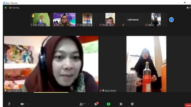
Gambar 5. Siswa Mempraktikkan Lambang Ketukan dari Pemateri

Berdasarkan petunjuk pada Tabel 1 di atas, hal ini dapat menjadi pengetahuan baru dan menambah wawasan siswa. Setelah pemateri menyampaikan lambang ketukan, siswa secara bergantian diminta untuk mempraktikkan ketukan yang diinstruksikan oleh pemateri. Kegiatan tersebut bermanfaat untuk meningkatkan daya ingat dan juga melatih psikomotor siswa, karena pada tahap ini siswa diminta untuk menghafal bentuk tangan pemateri sebagai lambang ketukan kemudian mempraktikkannya dengan cara memukul barang bekas di sekitarnya sesuai dengan lambang ketukan yang telah diingatnya. Kegiatan ini dapat dilihat pada Gambar 5.