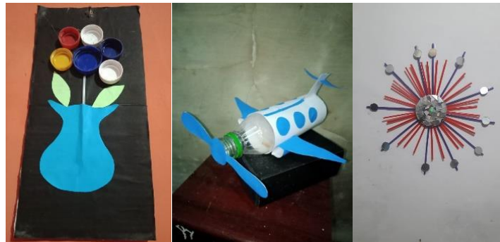
Gambar 6. Hasil Karya Pemanfaatan Barang Bekas

kreativitas siswa dalam memanfaatkan barang bekas. Berikut adalah beberapa hasil karya yang dibuat oleh siswa setelah mengikuti kegiatan webinar.