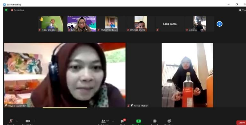
Gambar 3. Perwakilan Peserta Diminta untuk Mengikuti Arahan Pemateri Membuat Nada dari Barang Bekas

Tahap evaluasi yang dilakukan pada kegiatan webinar ini terdapat dua bentuk evaluasi, pertama perwakilan peserta diminta untuk membuat nada pada barang bekas yang dimilikinya lalu diikuti oleh peserta yang lain. Kedua, tahap evaluasi melalui pertanyaan seputar materi yang telah disampaikan diberikan kepada peserta diakhir kegiatan yang ditujukan pada Gambar 3.