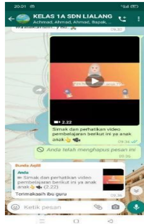
Gambar 5. Pendampingan Siswa lewat Media Pembelajaran Video di WhatsApp Grup

lebih memahami materi yang penulis sampaikan dan berpengaruh dalam hasil belajar siswa. Kemudian ketika ada yang belum memahami materi di dalam media pembelajaran berupa video ini, siswa ataupun orang tua boleh bertanya dan tentunya penulis akan menjelaskan ulang materi yang telah disampaikan. Setelah penulis memberikan materi pembelajaran berupa video ini, siswa senang ketika proses pembelajaran karena tidak hanya melihat tulisan berbentuk foto saja dan untuk soal latihan pun lebih jelas serta orangtua mendukung jika dalam proses pembelajaran selalu ada video pembelajaran seperti ini.