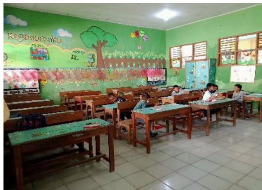
Gambar 7. Pendampingan Siswa melalui Tatap Muka Kelompok Kecil di Sekolah