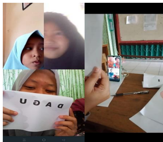
Gambar 3. Pendampingan Siswa Belajar melalui Video Call dan Menguji Siswa

Salah satu solusi dalam pembelajaran daring yaitu pembelajaran daring menggunakan video call melalui whatsapp. Dengan penggunaan media whatsapp dalam pembelajaran daring diharapkan ketika pembelajaran terlaksana dengan baik. Dalam melaksanakan pembelajaran daring melalui video call yang pertama penulis memberikan materi kepada siswa setelah itu barulah penulis menguji atau melatih siswa sampai mana siswa paham tentang materi yang sudah penulis berikan. Pembelajaran melalui video call ini teknisnya di setiap pertemuan melalui video call berjumlah 3 atau 4 siswa. Sehingga pembelajaran daring dapat berjalan secara dua arah ketika memanfaatkan fitur Video Call dalam WhatsApp dan memberikan satu inovasi proses pembelajaran menggunakan whatsapp yang tidak hanya berpatok pada penggunaan grup whatsapp saja. Dengan terlaksananya program pendampingan pembelajaran daring melalui Video Call dengan WhatsApp pada siswa kelas I SD Negeri Lialang diharapkan dapat membantu siswa maupun orangtua dalam memahami materi pelajaran dan juga mengerjakan soal latihan, sehingga siswa dapat berkolaborasi dengan baik saat melaksanakan pembelajaran daring di rumah dengan maksimal.