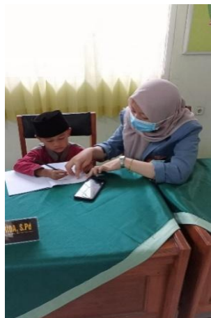
Gambar 6. Pendampingan Siswa Melalui Tatap Muka Dengan Protokol Kesehatan

Ketika ada siswa yang belum paham ketika belajar, penulis membolehkan siswa ke sekolah tentunya dengan prokes yang dianjurkan dan penulis akan membantu mengajari siswa tentang materi yang siswa belum pahami dan ketika ada siswa yang tidak mempunyai handphone boleh mengumpulkannya langsung di sekolah atau menitipkannya ke penjaga sekolah. Untuk siswa yang belum memahami materi yang diberikan oleh guru, penulis sebisa mungkin membantu siswa ketika belajar dan membantu mengerjakan soal yang diberikan oleh guru.