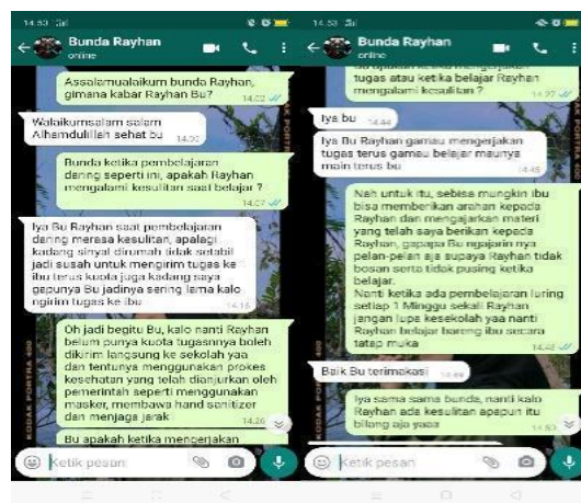
Gambar 4. Pendampingan Siswa Melalui Orangtua dan Monitoring Tugas

Solusi yang penulis dapat berikan untuk kegiatan KKN maupun kemajuan pendidikan jarak jauh selanjutnya yakni memperbanyak fasilitator atau guru yang terlatih menggunakan media pembelajaran atau menggunakan aplikasi-aplikasi yang digunakan untuk proses pembelajaran seperti zoom, google meet dan yang lainnya sehingga siswa dapat memahami materi seluruhnya yang disampaikan, penyediaan fasilitas belajar dan fasilitas pendukung pembelajaran melalui handphone, dan mengajak guru dan tenaga pendidik melakukan pendampingan yang serupa selama pembelajaran jarak jauh atau melalui handphone, serta jika memungkinkan dapat dilaksanakan pembelajaran dengan tatap muka langsung, namun hal ini mempertimbangkan banyak aspek terkait pencegahan dan penularan Covid-19 apabila kegiatan tatap muka dilaksanakan (Budastra, 2020; Dulkiah et al., 2020; Prasetyo & Suherlan, 2020).