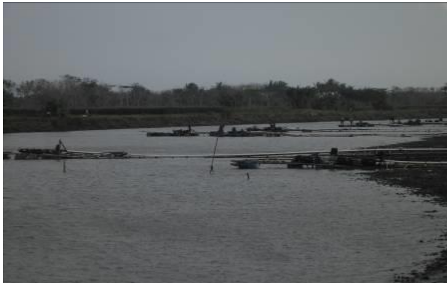
Gambar 4. lokasi penambangan pasir dan kegiatan penambangannya.

Klaim kepemilikan lahan sedimen masih sepenuhnya dikelola secara sangat sederhana oleh masyarakat, yaitu dengan pemasangan tiang sebagai penanda bahwa lahan tersebut sudah dimiliki oleh seseorang. Hal ini tentu rawan sekali menimbulkan konflik berupa perebutan lahan. Seperti informasi yang didapat dari hasil wawancara dengan masyarakat, apabila terjadi konflik maka diselesaikan secara musyawarah didampingi pemerintah tingkat desa di balai desa setempat.